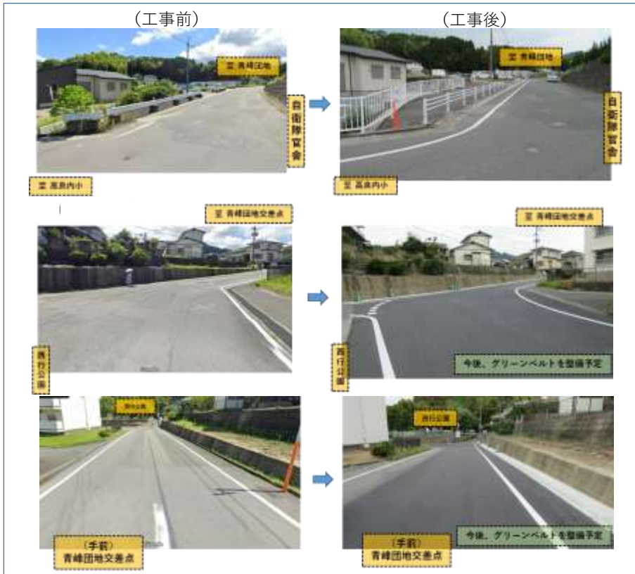
〈高良内小から青峰へ向かうルート〉