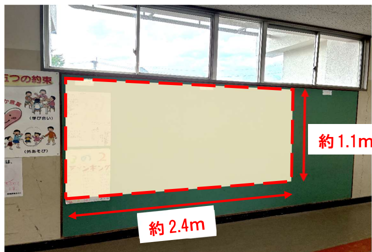
善導寺小学校 東棟（教室棟）の 昇降口に掲示します