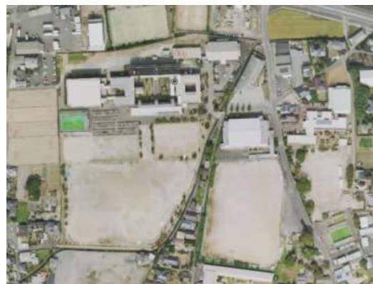
田主丸中学校グラウンド (貯留量 3,600m 3 )