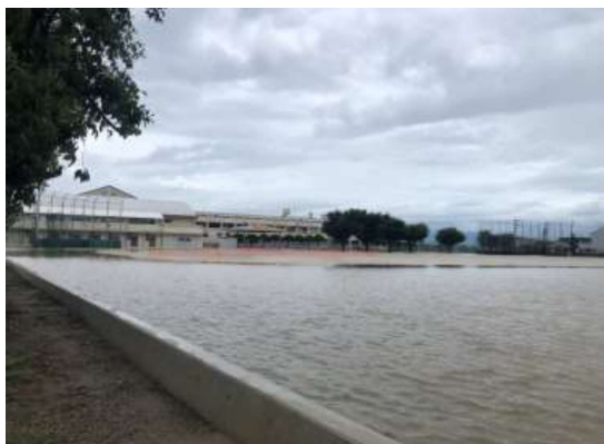
北野中学校グラウンド (貯留量 2,000m 3 )