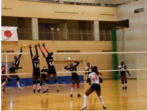
バレーボール（女子）