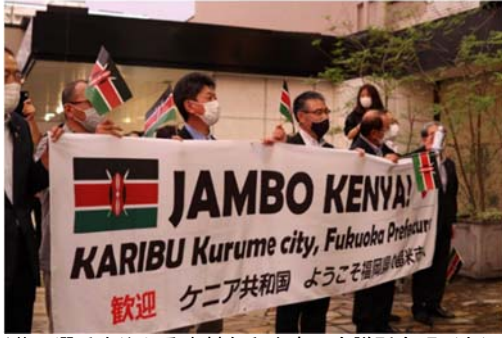
横断幕で選手を迎える本村久留米商工会議所会頭（右）、大久保市長（中央）、石井市議会議長（左）