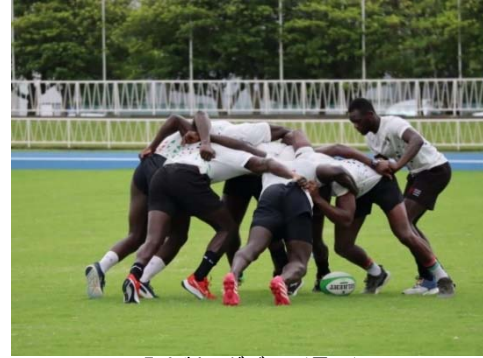
7人制ラグビー（男子）