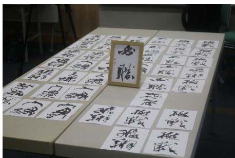
久留米連合文化会がケニア選手団へ贈る書を揮毫（6月28日 荘島体育館にて）