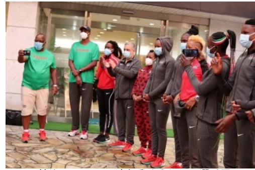
歓迎のメッセージを受けるケニア選手団