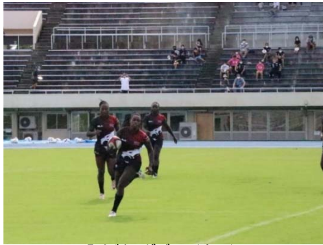
7人制ラグビー（女子）