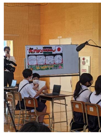
英語で説明を行う児童（川会小）