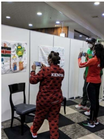
宿泊先に掲示された応援旗をみるケニア選手ら