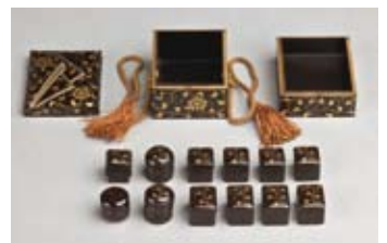
黒漆塗唐草に龍胆車紋時絵十二手箱 (久留米市教育委員会所蔵)

有馬家の姫様が所用したひな道具は、久留米藩21万石の大家家にふさわしく、職人の卓越した技術で緻密に制作され、小さくも華やかな輝きをいまに伝えています。ひな道具を中心に、有馬家の姫様ゆかりの豪華な品々を展示公開します。