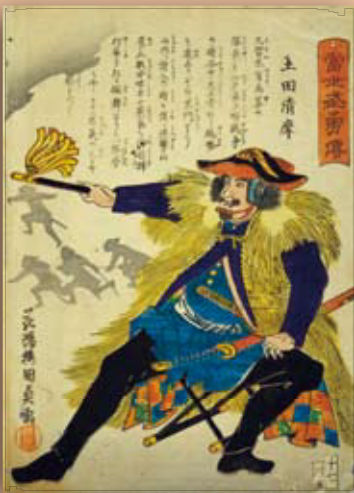
錦絵「当世武勇伝 土田清摩」