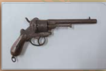
ピストル(ル・フォショウ六連発レボルバー)