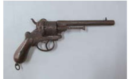
ピストル(ル・フォショウ六連発レボルバー)