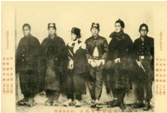
絵葉書「戊辰役従軍将士」（於京都撮影）

企画展「大名有馬家臣団」シリーズの第3弾は、本年が明治維新 150 年となる節目にあわせて、「久留米藩の幕末維新」をテーマに開催します。久留米藩の幕末志士や、戊辰戦争に参加した藩兵にまつわる歴史資料をとおして、激動の時代を紹介します。