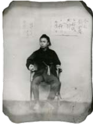
かに 可児鍋喜久ガラス写真