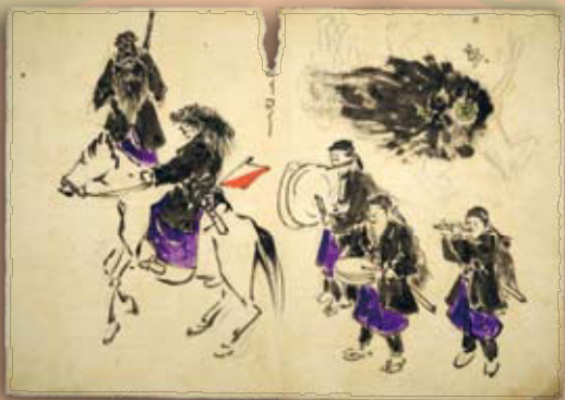
戊辰戦争時行進図