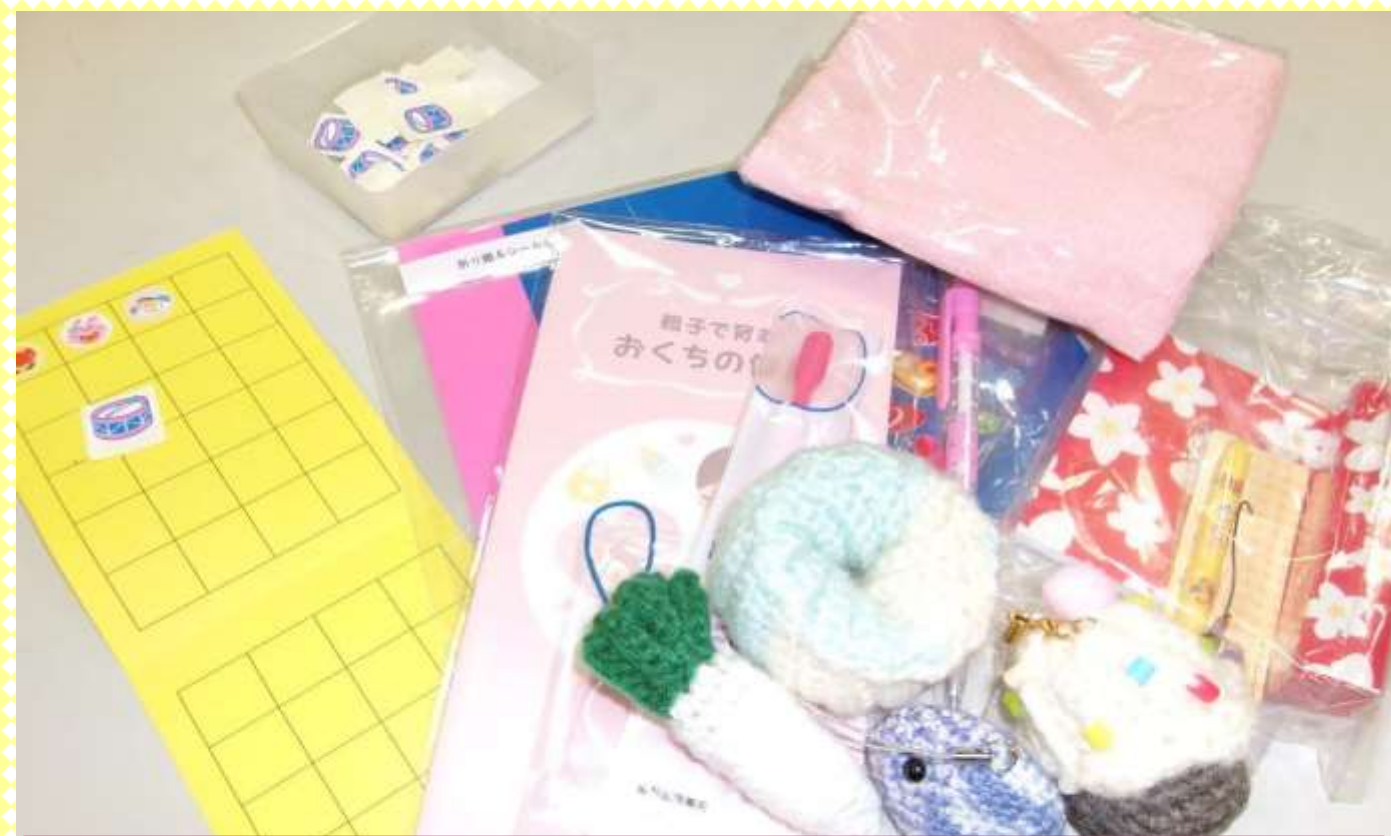
シールを全部ためると素敵なプレゼントあり♪