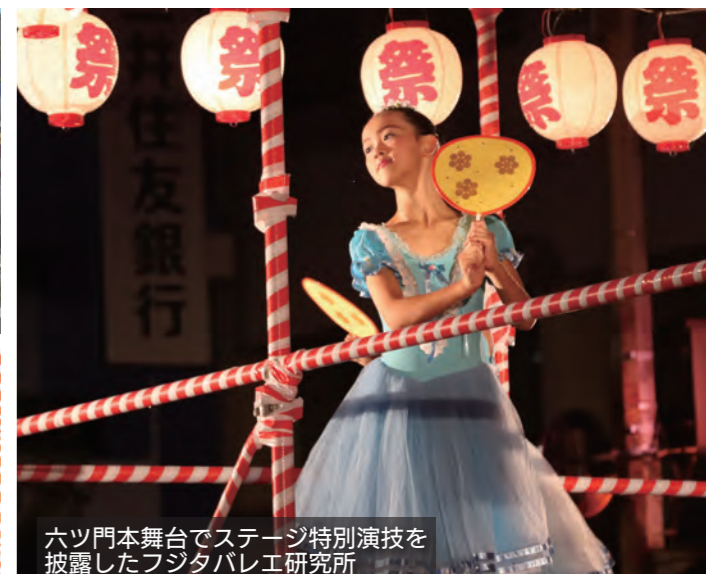
六ツ門本舞台でステージ特別演技を 披露したフジタバレエ研究所