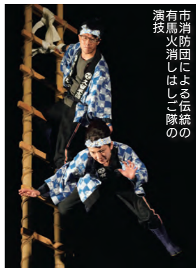
市消防団による伝統の 有馬火消しはしご隊の 演技