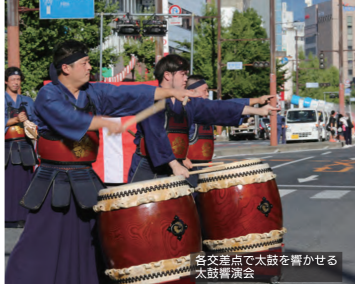
各交差点で太鼓を響かせる 太鼓響演会

などの踊りの技量、活気とチームの統一性など踊り連としての総合力が評価されました。5日に開かれた筑後川花火大会は、約8000発の打ち上げ花火に約40万人が訪れ、次々と打ち上がる花火に歓声をあげていました。今年も、新型コロナ感染拡大防止のため、家からでも花火大会を楽しめるように、初めてYouTubeで生配信しました。 ◎久留米観光コンベンション国際交流協会 (☎0942・31・17 17、FAX0942・31・3210)