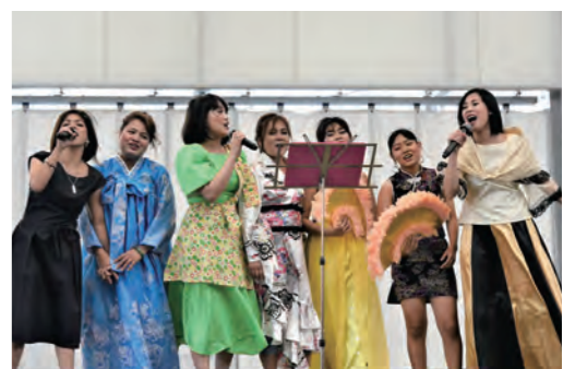
華やかな民族衣装でステージを盛り上げます。

10月2日(日)、久留米シティプラザ六角堂広場で「第9回 Kurume こくさい Day」を開催します。ステージでは各国の伝統音楽や踊りを披露。会場には国際色豊かなグルメ屋台も登場し、自慢の料理やスイーツを楽しめます。雑貨の販売や国際交流団体の活動状況の展示もあります。時間は12時から16時まで。会場に来る際は、感染防止対策に協力してください。 ④久留米観光コンベンション国際交流協会 (☎31・1717、FAX 31・3210)