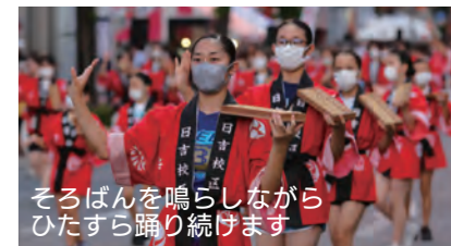
そろばんを鳴らしながら ひたすら踊り続けます