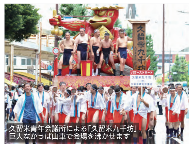
久留米青年会議所による「久留米九千坊」 巨大なカッパ山車で会場を沸かせます