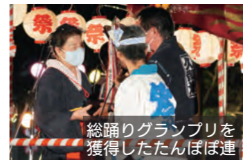
総踊りグランプリを 獲得したたんぼ連