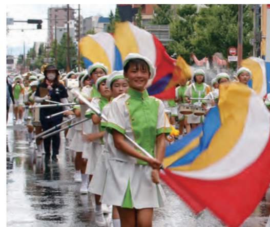
華やかな旗さばきで 観客を魅了しました