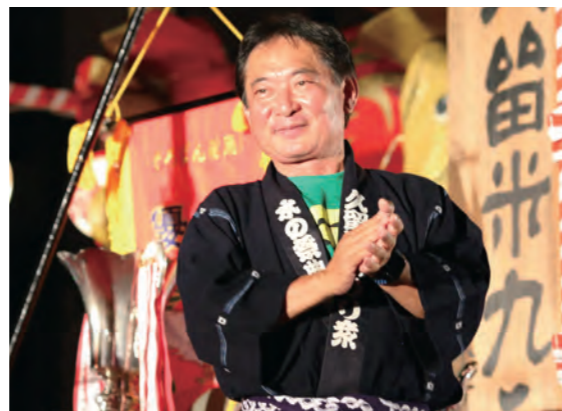
六ツ門本舞台から踊り連に声援を送る原口新五市長