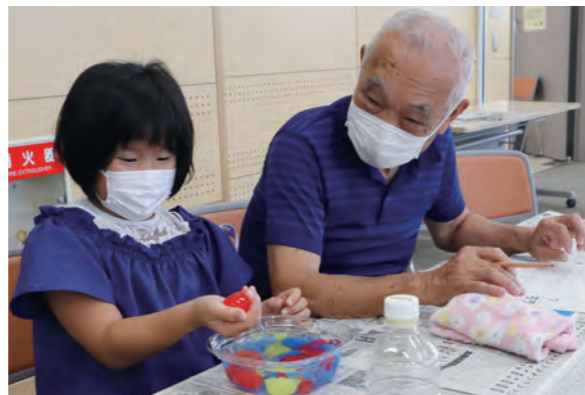
参加者は、出来上がった水の塊を触ったり、さまざまな方向から見たりして変化を確かめていました

環境交流プラザで、子ども夏休み教室「エコなつ」が開催されました。内容は、環境をテーマとした実験や工作で全15回。7月30日の「指でつまめる、不思議な水をつくらう」には、子ども15人と保護者が参加しました。海藻の成分で膜を作ると、持ち運びができることから、プラスチック容器削減のアイデアとして紹介。水の塊に触れた参加者は、ぶよぶよとした感触に歓声を上げていました。