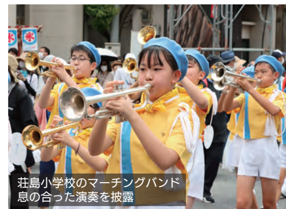
荘島小学校のマーチングバンド 息の合った演奏を披露