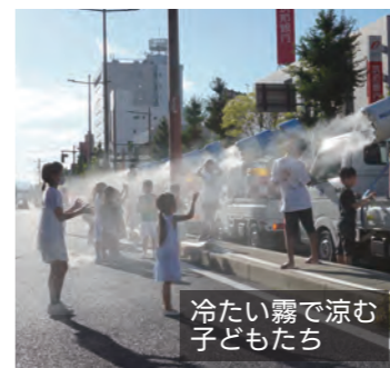
冷たい霧で涼む 子どもたち