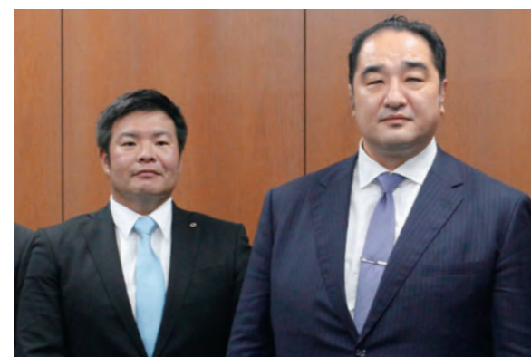
来訪した安治川親方（右）と真木宮司

7月25日に相撲の安治川親方（元関脇安美錦）と水天宮の宮司・真木啓樹さんが市役所を訪ねました。親方が力士の頃、太宰府天満宮で修業中の宮司と親交があり、これが縁で親方は16年前から水天宮保育園で園児とのふれあいを続けています。親方は、「相撲を楽しみに見てくれる人が増えればうれしい。今後も保育園との交流を続けたい」と抱負を語りました。