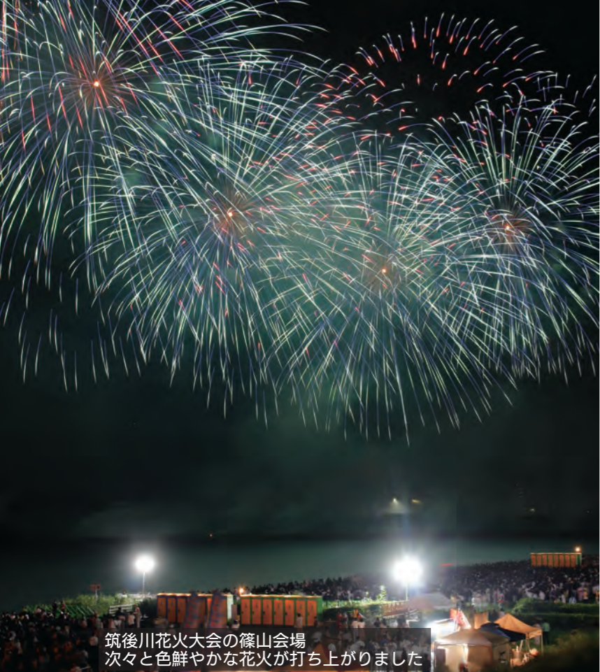
筑後川花火大会の篠山会場 次々と色鮮やかな花火が打ち上がりました