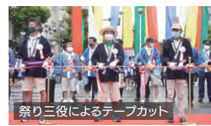
祭り三役によるテーブルカット