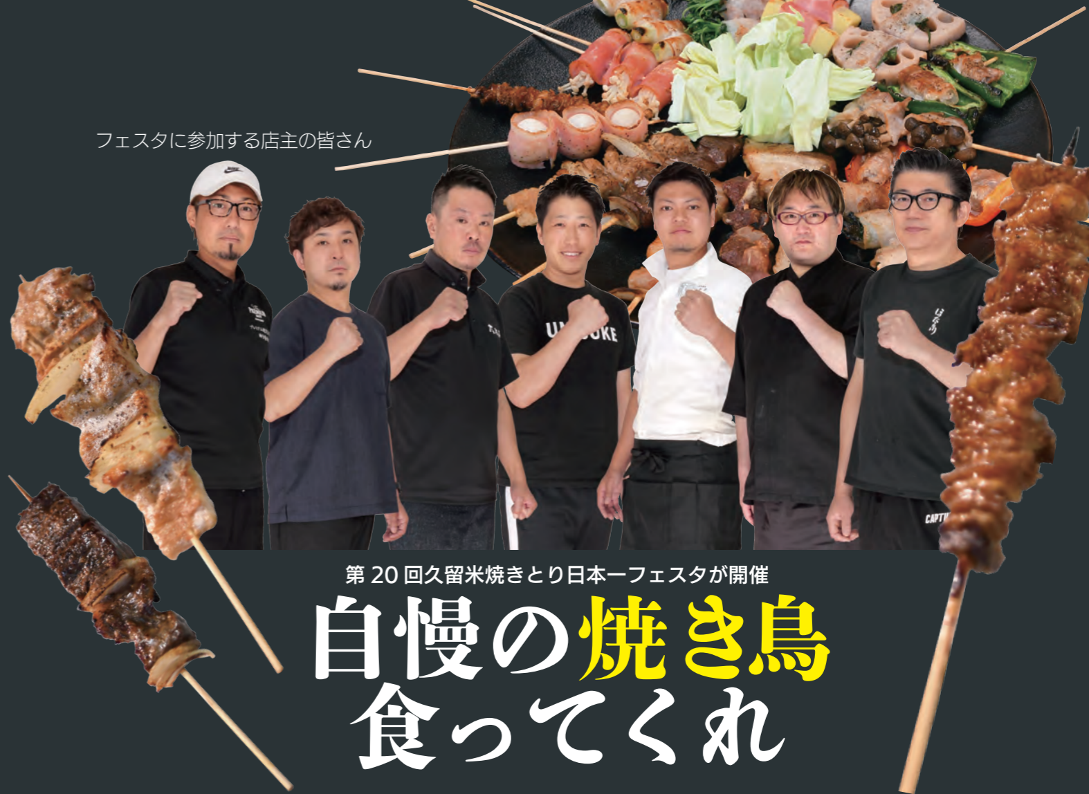
フェスタに参加する店主の皆さん