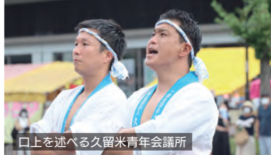
口上を述べる久留米青年会議所