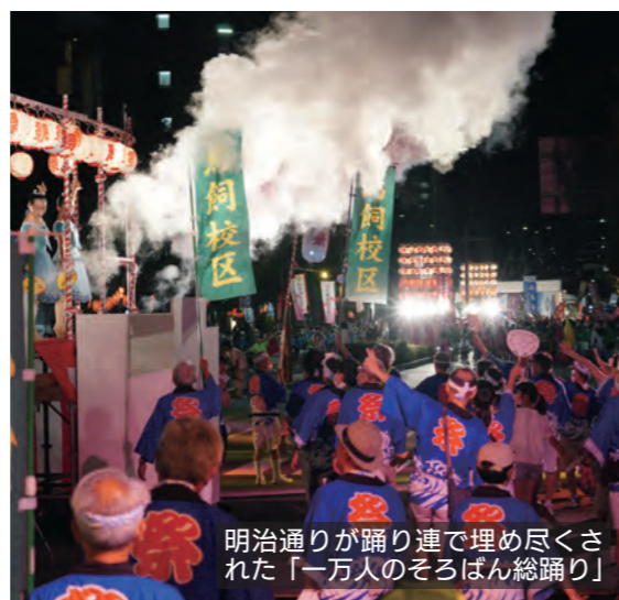
明治通りが踊り連で埋め尽くされた「一万人のそろばん総踊り」