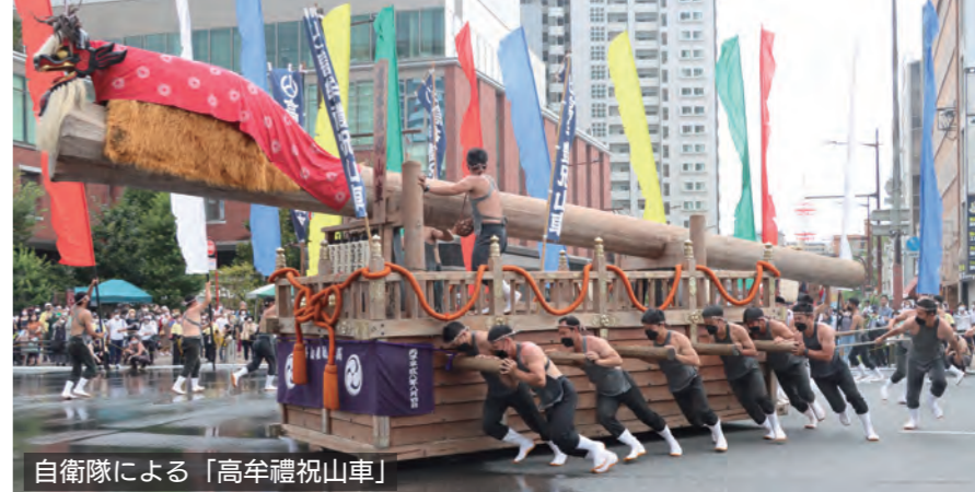
自衛隊による「高牟禮祝山車」