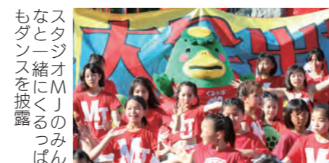
スタジオMJのみんなと一緒にくるっぴもダンスを披露