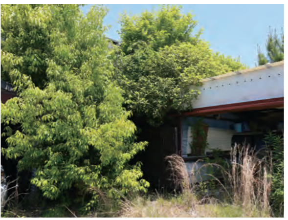
生い茂った雑草や樹木は、治安の悪化にもつながります

所有する土地が、適正に管理されず雑草や樹木が生い茂り、周りにさまざまな悪影響を与えているという相談が増えています。雑草や樹木が通行を妨げたり、近隣に損害を与えたりする害虫が発生する、野生動物が住み着く、異臭の発生など衛生面の悪化を招く