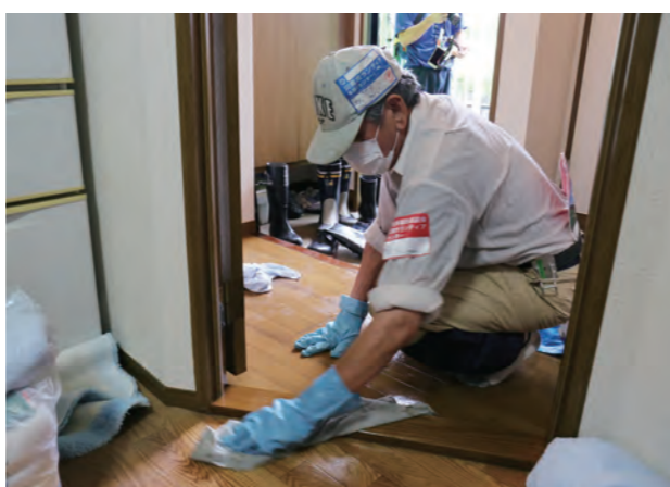
浸水した床を拭き上げるボランティア

災害が発生すると、私たちは、地域を回って浸水状況や必要な支援などを調査します。被災された皆さんは、一日も早く生活環境を