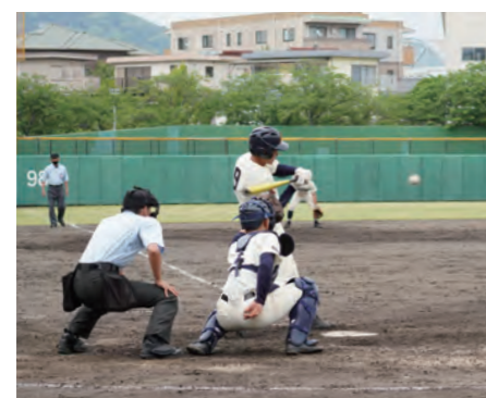
8ページに関連の記事があります