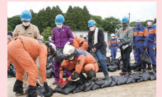
5月15日に上津小学校で、総合防災訓練を実施。土砂崩れからの救出やボートでの救助、避難所運営など本番さながらに行いました。