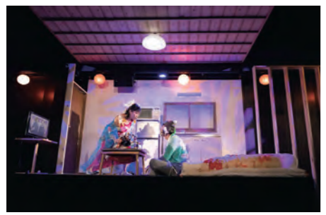
◀「妖精の問題デラックス」