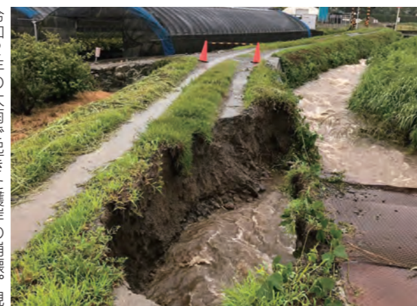
令和2年の大雨で起きた護岸の崩壊。現場写真をLINEで見ることができます

6月6日(月)から新たな取り組みとして、LINEを使った「久留米市防災チャットボット」を運用します。市職員や地域役員、消防団員などが確認した被害情報をLINEで収集し、発生場所を地図に表示します。冠水、道路崩壊などの災害の種類ごとに件数で示し、現場の写真がコメント付きで投稿されます。ハザードマップや河川水位、水門の閉鎖状況など