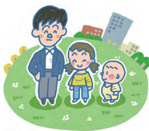
低所得の子育て世帯を応援します

■支給時期 ①は6月30日(木)に児童扶養手当を支給する口座に振り込み。②は7月末までに手当を支給する口座に振り込み予定。③は申請書受け付け後、申請日の翌月末に順次振り込み予定 ④家庭子ども相談課 (0942・30・9739、FAX 0942・30・9718)