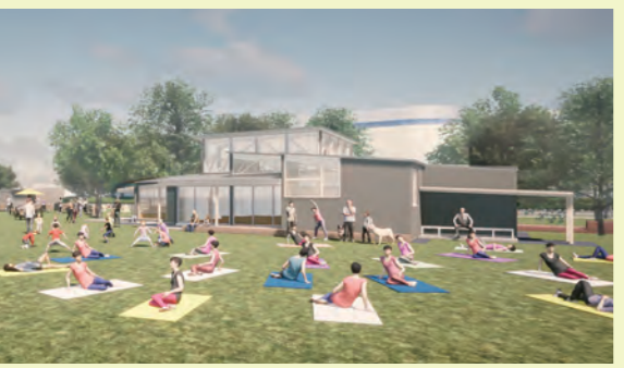
イメージ図。芝生広場では、青空ヨガやスポーツ教室も開催します

スタジオリも完備。イベント広場では、マルシェなども出店します。新しい施設は「KURUMERU(くるめる)」と名付けられました。◎公園緑化推進課(☎0942・30・9085、FAX0942・30・9707)