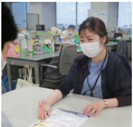
市民に寄り添った対応が求められます

なります。必ず、受験資格や試験内容などの詳細をまとめた試験案内を確認してください。受験申込書や試験案内は、市ホームページからダウンロードできます。郵送請求も可能です。