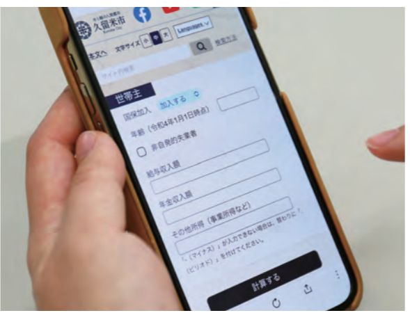
パソコンやスマホで、簡単に保険料を計算することができます

令和4年度の国民健康保険料納付通知書を、6月13日(月)から世帯主宛てに順次発送します。国民健康保険料は、加入者の所得や同居する人数などに応じて世帯単位で納めます。今年度分から子育て世帯の負担軽減を図るため、小学校入学前の