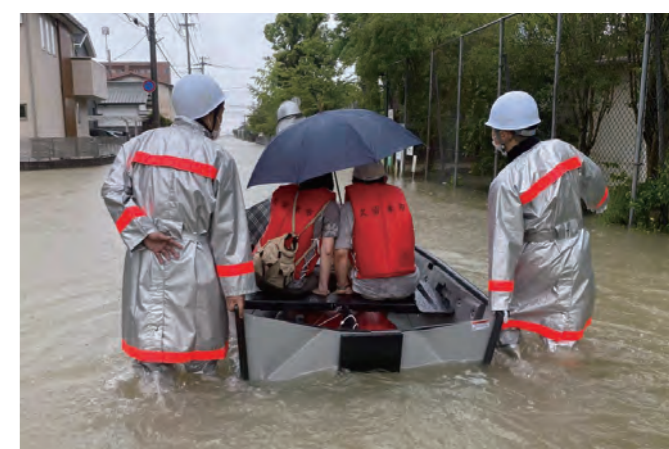
昨年8月の大雨災害で地域住民をボート救助した第11分団

回復したいと、無理を重ねています。中には、「ボランティアの皆さんも大変だから」、「何度もお願いしているのか」と気を使っただ慮する人も。以前、支援に入った家で、床上浸水でベッドがぬれたにも関わらず、そこで3日も寝ていた高齢者がいました。困っていることを言い出せなかったんだと思います。すぐに貸出用のベッドを手配しました。支援を続ける