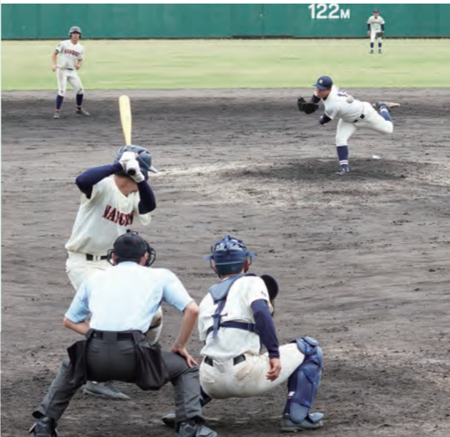
勝利をつかむために両校の選手が投打に全力を尽くしました

南筑創立百周年記念で 5月11日に、第73回久南定期戦が開催されました。例年、久留米商業高校と南筑高校の野球部が市長杯をかけて激闘を繰り広げる一戦です。新型コロナウイルスの影響で中断し、3年ぶりの開催。今年は南筑高校の創立100周年を記念して、午前には久留米アリーナで女子バレーボール、バドミントン、剣道の対戦もありました。オープニングセレモニーでは南筑がダンス、久留米空手道部が演武を披露し、華を添えました。 午後からは市野球場で野球部の