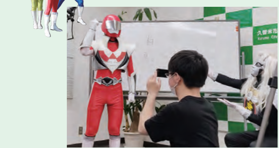
久留米工業高等専門学校の学生と共同で動画などを制作しています