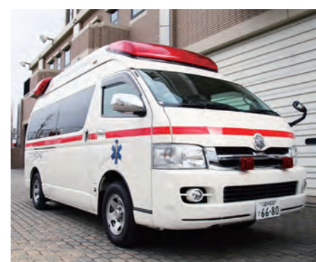
14ページに関連の記事があります