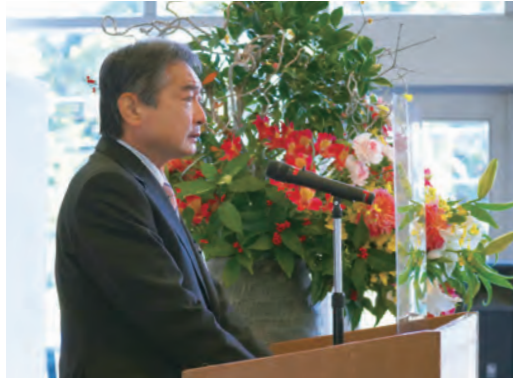
1月31日の初登庁日は、市の幹部職員を前に訓示を述べました