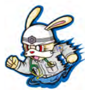
スーパーラビット

病程度別にみると、重症以上13・8%、中等症43・5%、軽症42・7%で、平成21年の久留米広域消防本部発足以降、初めて中等症が軽症を上回りました。一般負傷により搬送された人は3184人で、転倒や転落による受傷が82%を占めます。室内にまずくような物を置かない、移動する際は足元を明るくするなどの対策が必要です。