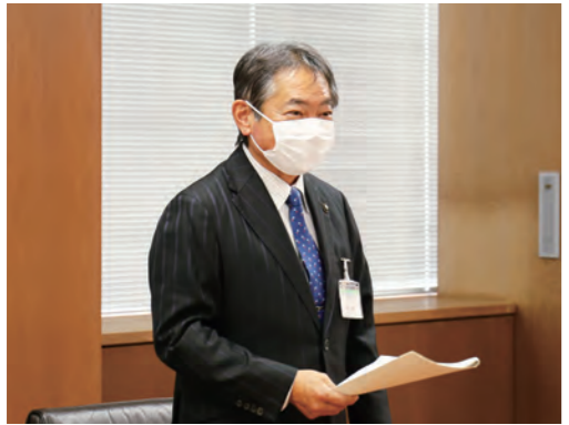
今後のまちづくりや各部局の懸案課題について意見交換をしました