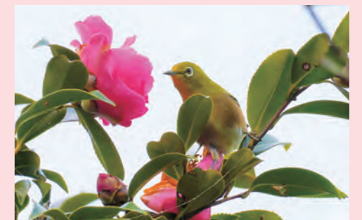
久留米市世界のつばき館では、各国のツバキが楽しめます。表紙の乙女椿は、ブランド「シャネル」のモチーフといわれています。