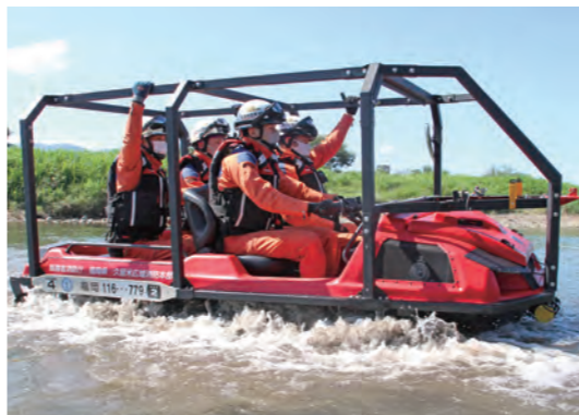
令和3年8月の大雨災害で活躍した水陸両用バギー

火災件数は121件で、前年から13件増加。3日に1件の頻度で火災が発生しています。火災の種類は、建物火災が71件、車両火災が18件、その他の火災が32件でし