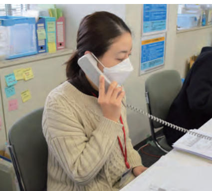
まずはコールセンターに電話してください