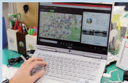
試験導入したAI防災チャットボット。地図上で現場写真などを確認できます

2月25日から第2回市議会が開会しました。4月から6月までの暫定予算を審議する予算審査特別委員会も開催。3カ月のつなぎ予算のため、市民生活に必要な公共サービスの維持経費が主ですが、喫緊の課題である新型コロナ対策や防災・減災対策など602億8千万円を計上しています。濃厚接触者のPCR検査費用や浸水対策のフラップゲートの整備、AI防災チャットボットの本格導入などが主なものです。