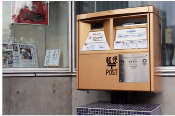
ゴールドポストの横には、素根選手のパネルや直筆のサイン、広報久留米号外を展示しています

2月14日、日本郵便が市役所東側にゴールドポストを設置しました。東京2020オリンピックピックで金メダルを獲得した選手のゆかりの地を盛り上げるプロジェクトです。ポストには、本市出身で金メダリストの素根輝選手の栄光をたたえるプレートも。久留米郵便局の首藤公文局長は「素根選手の偉業を忘れないためにも、皆さんに利用してほしいです」と呼び掛けました。