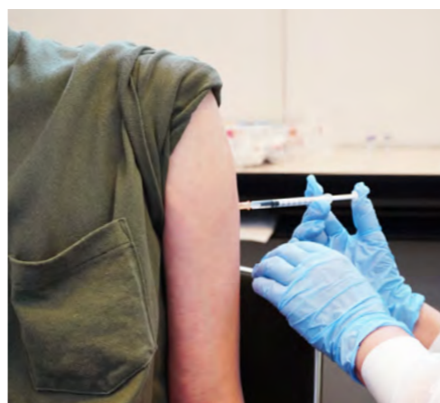
交互接種は有効性が高く、副反応にも大きな差はありません

これが3回目の接種で発症予防効果は約75%、入院予防効果は約95%まで上昇。接種後3カ月までの死亡抑制効果に至っては、最大で約99%まで高まります。2回目接種から6カ月経過後は、できるだけ早く3回目の接種を行うことを勧めます。