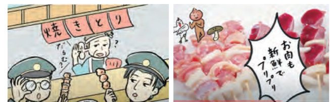
ダルム?ヘルツ?謎メニュー編 素材と焼きが違う編

久留米焼きとり文化振興会が、「久留米焼きとり」の歴史や魅力を紹介する動画を制作し、YouTubeに公開しています。ダルム・ヘルツがドイツ語に由来するルーツや、串の種類の豊富さなどをイラストや写真で伝えます。動画は、短編7本と総集編の計8本。焼き鳥を食べたくなること間違いなし。 ☎同事務局 (☎ 27・5616、FAX 31・3210)