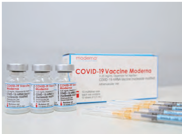
ワクチン接種は自分を守るだけでなく、周りの人を守ることもつながります