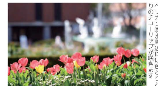
パブリックスペースの隅には色とりどりのチューリップが咲き誇ります。

石橋文化センターでは、ツバキが見ごろを迎えています。4月になるとサクラやチューリップが咲き誇ります。ビオラ、ポピー、アネモネなど花壇の花も4月下旬頃まで咲いています。四季の中で、最も多くの花を見ることができます。 ☎同センター (☎ 33・2271、FAX 39・7837)