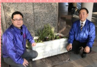
岩田屋久留米店の皆さん