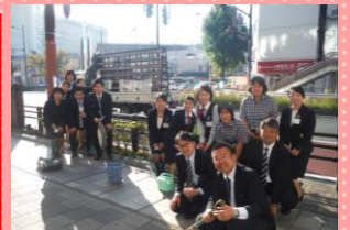
福岡銀行東久留米支店の 皆さん