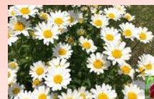
ノースポール パンジー

また、 パンジーはまめに花殻つみ をおこなうと、見た目がよく、花付きもよくなります。