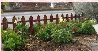
歩道側に一年草を、車道側にはガザニアを配置した花壇です。

「まずは簡単な花がら摘みからやってみるといいと思います。きれいな状態を保てると自分自身とてもうれしくなるし、花壇を見ていると癒されます」