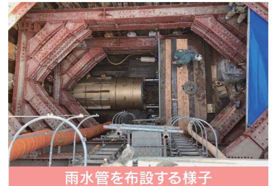
雨水管を布設する様子