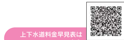
上下水道料金早見表はこちら