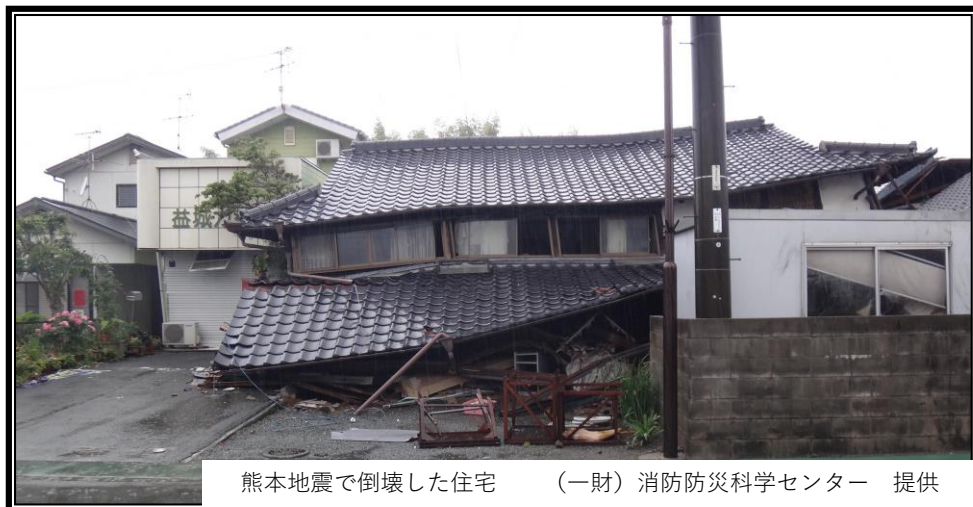
熊本地震で倒壊した住宅

『耐震診断』を自己負担3,000円で実施可能です！ 福岡県耐震診断アドバイザー派遣制度と久留米市補助を活用し、 ご自宅の耐震性について調べてみませんか？