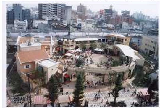
久留米六角堂広場

しかし、福岡市天神地区や周辺市町に立地する大型商業集積への消費者流出、IT時代におけるインターネットを活用した無店舗販売の拡がりなどで、大型店や商店街で構成する中心商業の年間販売額は低下し、とりわけ旧態依然の商店街に対する消費者の支持は薄らいでいった。