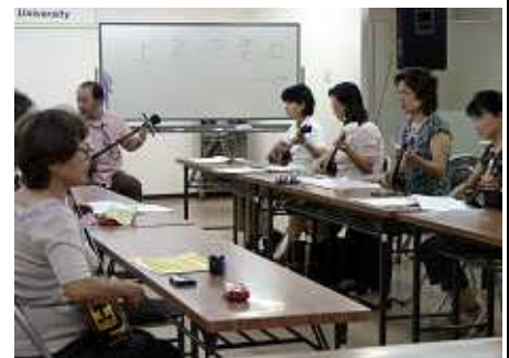
六ツ門大学（三線講義）の風景

TMO や商店街、大型店、商工団体、市民などが結集し、冬季の賑わいづくりとして平成 17 年から通りや広場を光で彩るイルミネーション事業「光の祭典」を行っている。