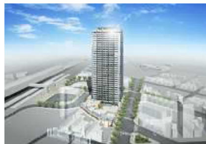
J R 久留米駅周辺整備イメージ

新世界地区再開発事業は、計画予定地区のうち地権者の同意が整った第一工区において、21 年着工、22 年竣工を目指し、共同住宅を基本とした優良建築物等整備事業を推進している。