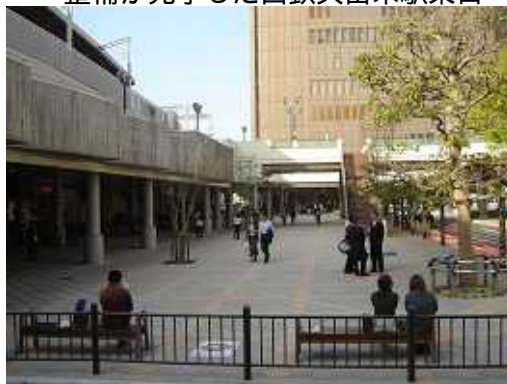
整備が完了した西鉄久留米駅東口

都市景観形成事業については、平成 20 年 4 月の中核市移行により景観行政団体になることを受け、景観法に基づく景観計画の策定準備を進めている。平成 22 年度には、景観計画の実効性を確保するため、景観条例を定め、県南の中核都市久留米にふさわしい美しく魅力ある都市づくりに取り組んでいく。