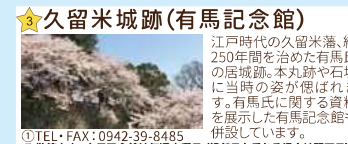
★久留米城跡(有馬記念館)