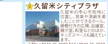
★久留米シティプラザ