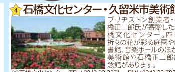
★石橋文化センター・久留米市美術館