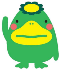
久留米市 くるっば