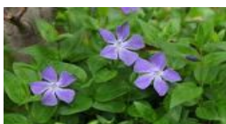
ツルニチニチソウ