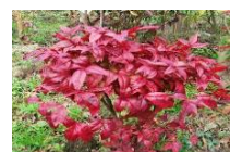
オタフクナンテン