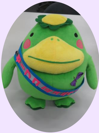
毎年、市の職員もパープルリボン 3,000 個を手作りしています。