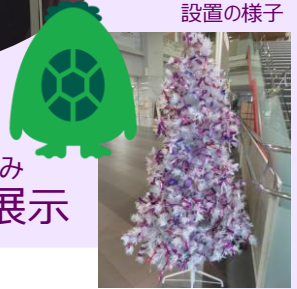
市役所 1階ロビー 設置の様子