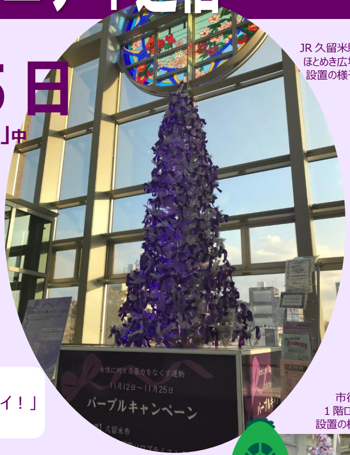
JR 久留米駅 ほとめき広場 設置の様子

セーフコミュニティでは、この期間に合わせて「パープルキャンペーン」を実施し、女性に対する暴力の根絶を目指しています。