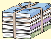
雑誌類(菓子箱含む)