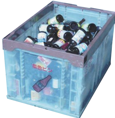
茶色のビン回収容器