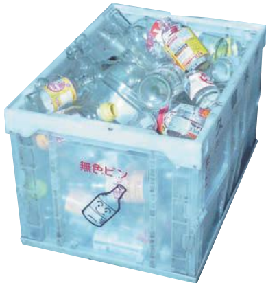
無色のビン回収容器