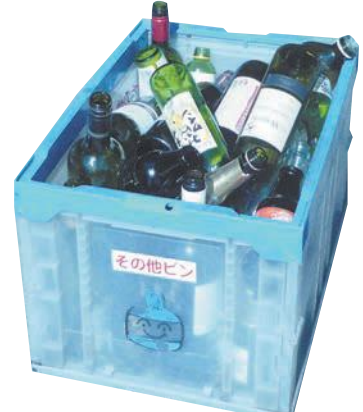
その他のビン回収容器