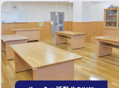
サークル活動やDIYに

宮ノ陣クリーンセンターでは、ごみ処理の仕組みや流れを実際に見ることができます。環境交流プラザではガイド付き見学(※要予約)の受付も行っていますので、一緒に工場見学ツアーに出発しましょう。