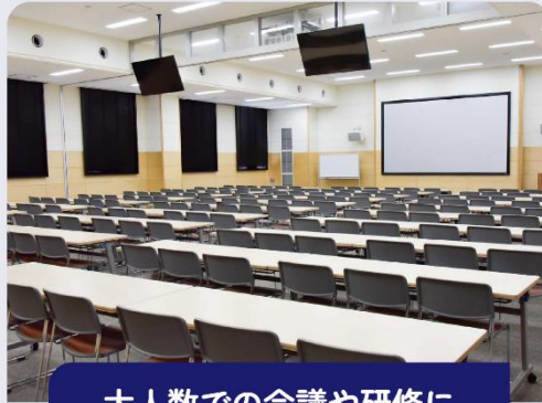
大人数での会議や研修に

「環境学習ルーム」では、4つのゾーンでゲームやクイズ、工作などの体験をとおして、環境について学ぶことができます。完全屋内なので、雨の日でも楽しめます。