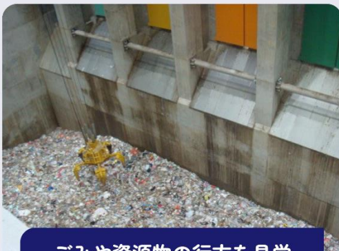
ごみや資源物の行方を見学

絵本やおもちゃがある「キッズルーム」。授乳室、オムツ替えスペース(バリアフリートイレ内)完備で、ベビーカー貸出も行ってあります。小さいお子さん連れでも安心してお越しください。