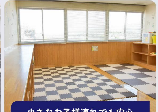
小さなお子様連れでも安心

定員200名の「大会議室」は、スクリーンや音響設備を完備し、大人数での会議や研修など、用途に合わせて幅広く利用可能です。(有料・先着順)