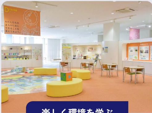
楽しく環境を学ぶ

「環境学習ルーム」では、4つのゾーンでゲームやクイズ、工作などの体験をとおして、環境について学ぶことができます。完全屋内なので、雨の日でも楽しめます。