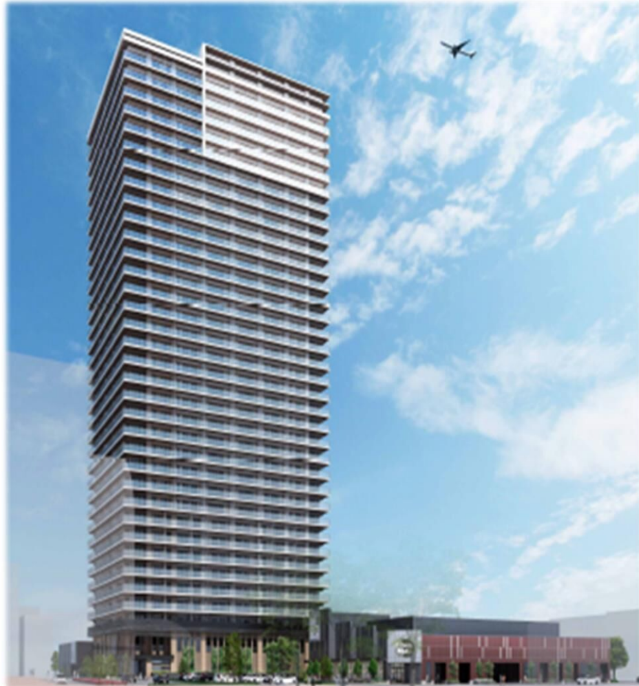
完成イメージパース