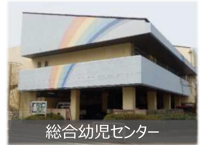
総合幼児センター