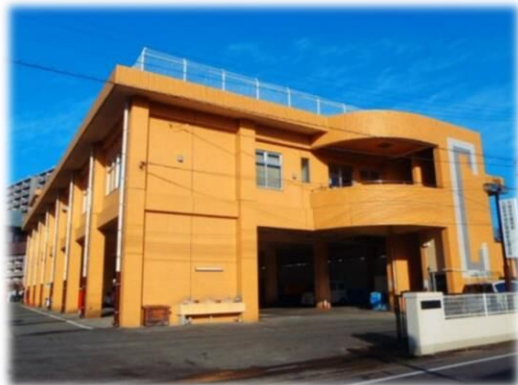
環境部庁舎（太陽光発電エネルギー）