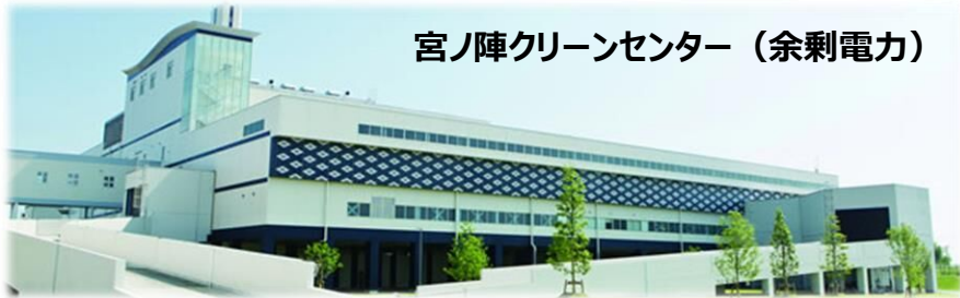
宮ノ陣クリーンセンター（余剰電力）