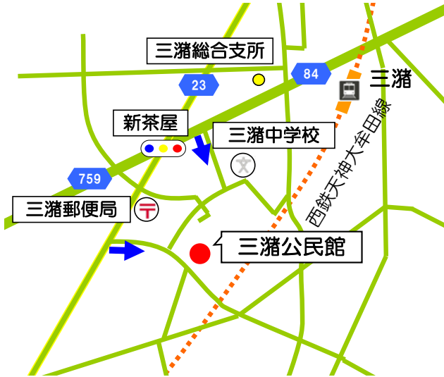
三瀧公民館多目的ホール (三瀧町玉満 2949 番地 1)