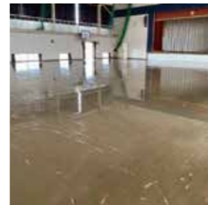
床上浸水した大橋小学校体育館

令和5年7月の大雨で被災した大橋小学校体育館の床の張り替え、プールのろ過機修繕の費用として、3,600万円を増額補正するものです。