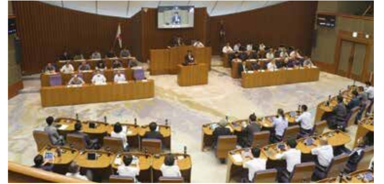
議案の議決結果と賛否の状況はP7へ