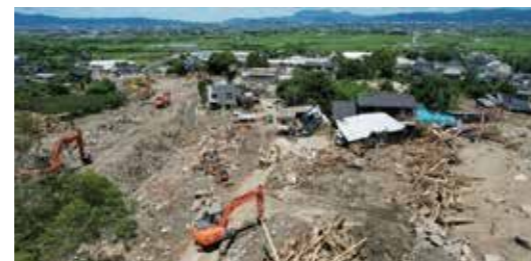
民地内に流入した岩石や樹木等を除去

令和5年7月の大雨で全壊した家屋の解体・撤去の支援や、受け入れた災害ごみの処理、損傷した道路や河川の復旧などの費用として、60億2,251万円を増額補正するものです。