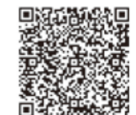
寄付の禁止について

問い合わせ先：選挙管理委員会事務局 TEL 0942-30-9238 FAX 0942-30-9752