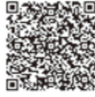
久留米市議会基本条例