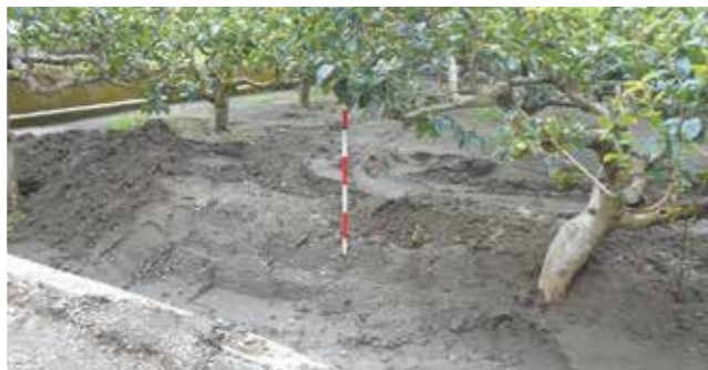
土砂が流れ込んだ果樹園