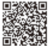
久留米市議会 公式YouTubeチャンネル