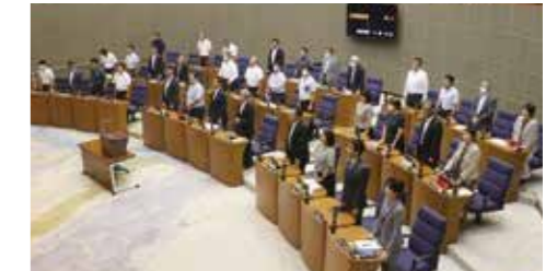
9月定例会での採決