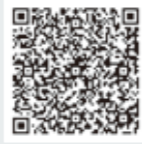
久留米市 令和4年度決算

昨年度は、コロナ感染症や物価高騰への対策として、一般会計では7度の補正予算が組まれました。その決算に対し、議会は「問題を浮き彫りにし、令和6年度の予算編成へどう生かすか」という視点を持って審査しました。