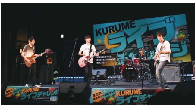
アマチュアミュージシャンが出演するイベント「くるめライブチャレンジ」