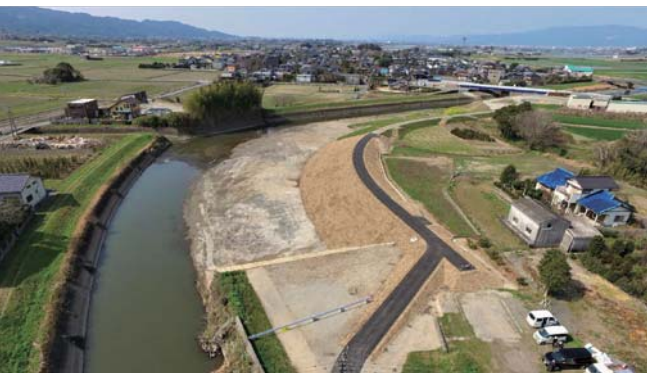
巨瀬川の河道掘削工事

A 堤防整備や河道掘削 ※5 、橋の架け替えなど5割程度の工事が終了しているが、さらなる改修促進を要望している。また、浸水箇所の堆積土砂の除去や樹木の伐採なども適宜要望していく。