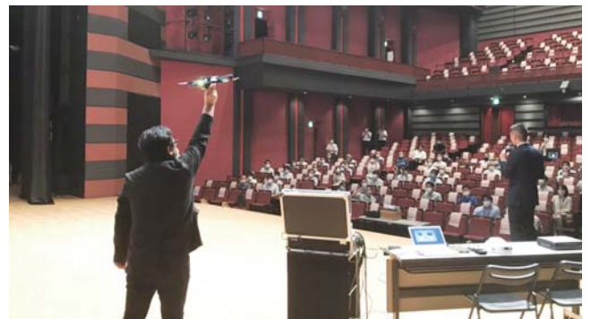
職員向けのドローン研修