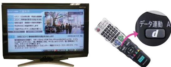
KBCテレビの画面でdボタンを押すと、dボタン広報室でイベントや市政情報が確認できます。

発行回数の見直しにより、適時の情報発信が課題となる。そのため、ホームページやSNSを活用して随時情報を発信したい。また、現行のくーみんテレビやドリームFMに加えて、4月からは九州朝日放送(KBCテレビ)のdボタンを活用した情報発信も新たに始める予定である。