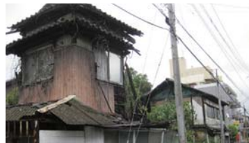
特定空家等に認定された家屋 (左の建物)

適切に管理されていない空き家などへの対策をさらに進めるために、「特定空家等 ※2 となるおそれがある空き家等」の所有者等に対する措置を規定するなど、条例を改正するものです。