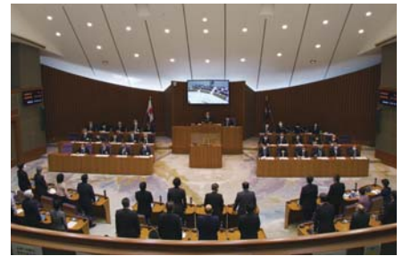
3月定例会での採決