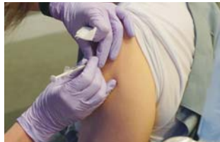
ワクチン接種の様子

医師会と接種体制について協議を行っており、現在、診療所を含む市内80の医療機関からワクチン接種を検討するとの回答をもらっている。市では、医療機関に対して、ワクチンや接種体制の説明会を行っており、今後も接種体制の整備に努めていきたい。