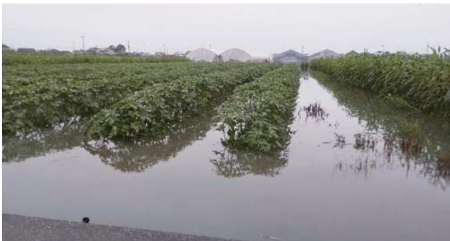
浸水した安武地区のオクラ畑

A 災害発生後ただちに、被害状況を調査して県へ報告し、農林水産大臣へ災害復旧支援の要望書を手渡した。支援額は、施設等の復旧や種苗の購入など約5億6,000万円となる見込みである。