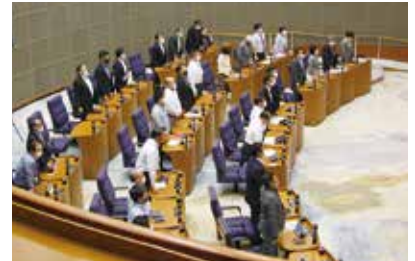
9月定例会での採決