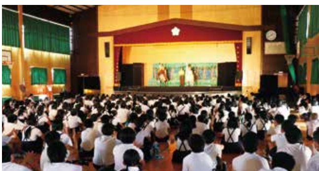
10月に行われた統合対象校合同行事の観劇会