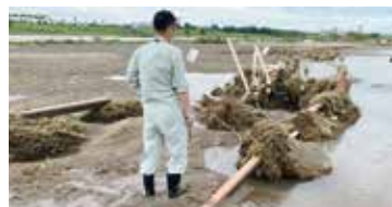
豪雨被害を受けた リバーサイドパーク

令和2年7月豪雨災害で、リバーサイドパークなどに堆積した土砂や流木の撤去、削り取られた部分を補修するための公園災害復旧費として、5億3,813万円を増額補正するものです。