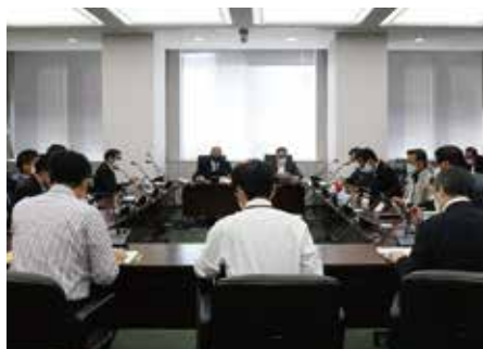
さまざまな視点から協議を重ねています

昨年の議会基本条例の検証を踏まえ、議会制度調査特別委員会では、「一般質問の際の一問一答制の導入」と「委員会の映像配信の導入」について、8月から調査を行っています。