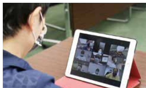
タブレット端末を活用した模擬会議

新型コロナウイルスなどの感染症予防の対策や豪雨などの災害発生時に、会議に出席することが困難となることを想定し、7月31日の災害対応連絡会議で、使い方の研修も兼ねたオンライン模擬会議を実施しました。今後、新たな会議ツールとして活用していく予定です。