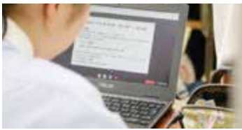
児童生徒用 ノート型パソコン

国のGIGAスクール構想に基づき、小・中学校の教育ICT環境を整備するため、全児童生徒の3人に2台分の児童生徒用ノート型パソコンとして16,234台を7億3,040万円で取得するものです。