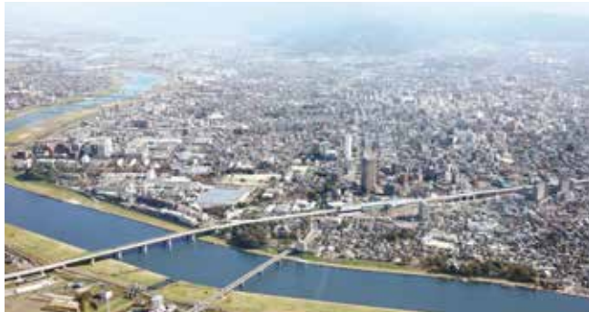
人口30万都市久留米

A 転出理由の一つには、良質で高所得の雇用を求めていることが考えられる。企業誘致や、デジタル化による生産性の向上を進めるなど、高い価値や賃金を生み出す地域企業の育成に取り組みたい。