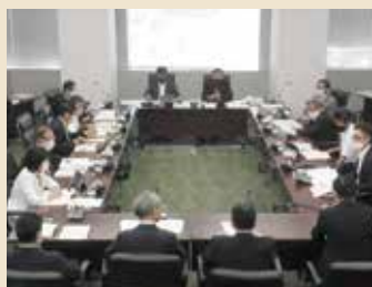
監査委員への質疑