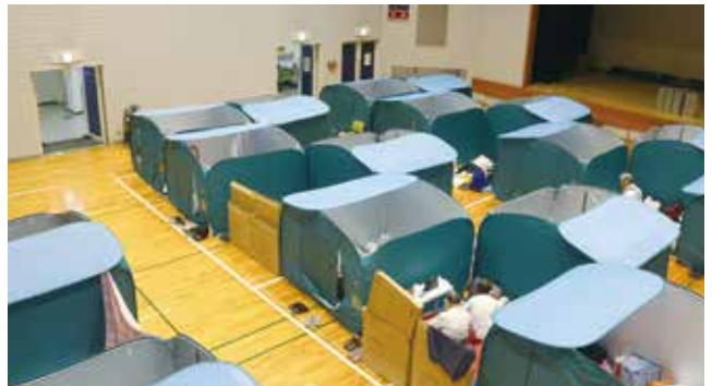
コロナ対策のためパーティションで仕切られた避難所