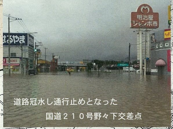
道路冠水し通行止めとなった 国道210号野々下交差点

下弓削川 (合川地区) 被害件数 344戸 ・床上浸水 134戸 ・床下浸水 210戸