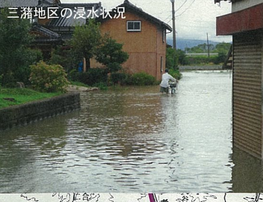
三猪地区の浸水状況

山ノ井川 (城島・三猪地区) 城島地区 三猪地区 総雨量 334.5mm 365.0mm 時間最大雨量 39.0mm/h (6日 18:00) 40.0mm/h (6日 19:00) 被害件数 202戸 61戸 ・床上浸水 36戸 4戸 ・床下浸水 166戸 57戸