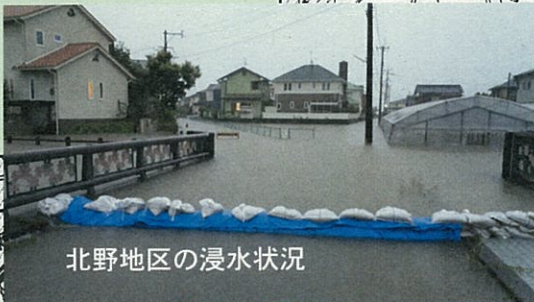
北野地区の浸水状況

陣屋川 (北野地区) 総雨量 393.5mm (総合庁舎観測) 時間最大雨量 54.5mm/h (6日 18:00) 被害件数 298戸 ・床上浸水 11戸 ・床下浸水 287戸