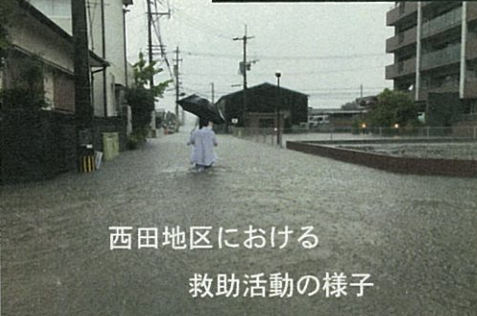
西田地区における 救助活動の様子

池町川 (西田地区) 被害件数 338戸 ・床上浸水 204戸 ・床下浸水 134戸