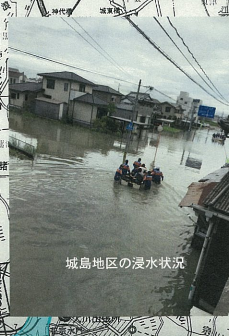
城島地区の浸水状況