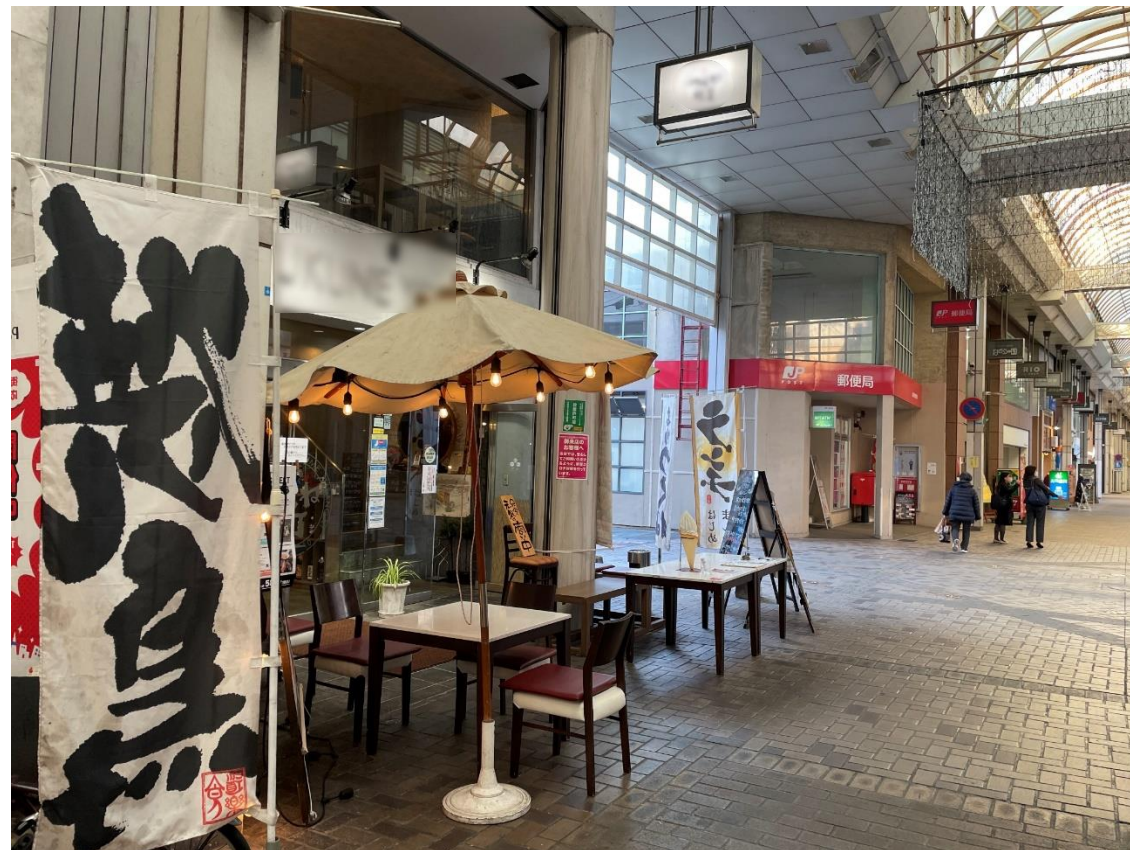
コロナ占用特例での活用