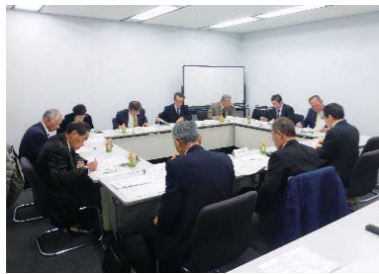
委員の代表者により再度書類の内容を確認