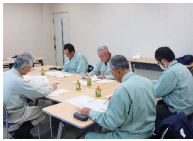
東部地域と西部地域に分かれて書類審査等を実施