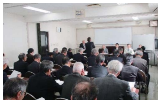
▲長崎市での研修の様子

「地図作成やデータ整理作業が削減・省力化できた。また、GPS機能により位置確認ができるようになり、調査の精度が向上した。」という意見があり、タブレット端末による調査の有効性などについて、実際に操作しながら説明を受けました。