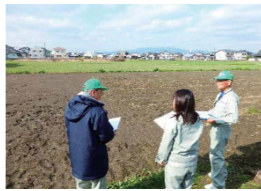
担当地区の農業委員と農地利用最適化推進委員が、対象農地の状況を現地確認

農地の権利移動や転用などの許可申請書が提出された後、農業委員会ではどのような確認を行っているのか、その一部をご紹介します。