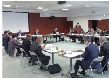
農業委員会総会にて許可に相当するかを審議