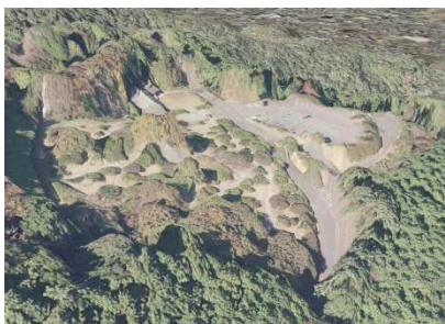
（3次元データ表示例）

森林資源量解析、森林カルテ作成、 3次元データ作成3次元ビューア導入、 意向調査の実施等（104件） 意向調査後フロー図の更新作成