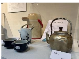
やかん、電気ポット