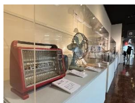
電気ストーブ、扇風機