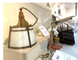
つ り下げ電灯、 けいこうとう 蛍光灯