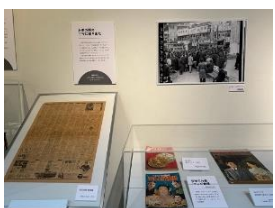
新聞、雑誌（テレビ関連記事）