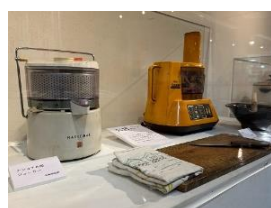
まな板、ブレンダー