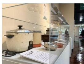
はがま 羽釜、電気炊飯ジャー