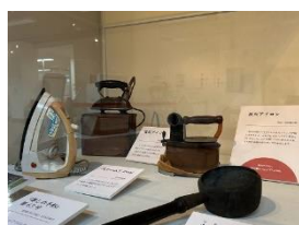
ひのし 火熨斗、炭火・電気アイロン