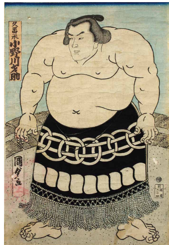
久留米小野川才助図（久留米市教育委員会蔵）

水害を潜り抜けた小野川の遺品は、ほどなく善導寺小学校へ寄贈され、平成28年に文化財保護課へ移管されました。