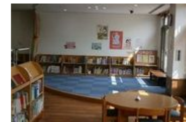
児童閲覧コーナー