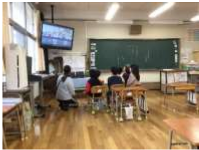
〈リモート交流中の青峰小の子どもたちの様子〉