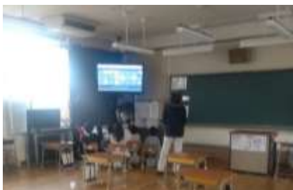
<リモート交流中の青峰小の子どもたちの様子>