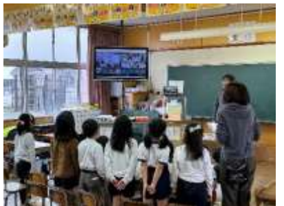
〈リモート交流中の高良内小の子どもたちの様子〉