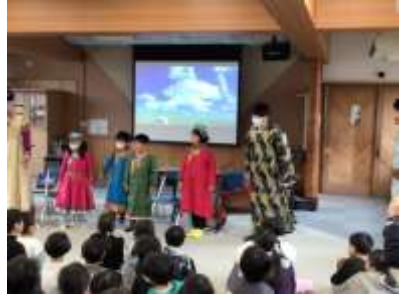
〈馬頭琴の音楽鑑賞中の子どもたちの様子〉