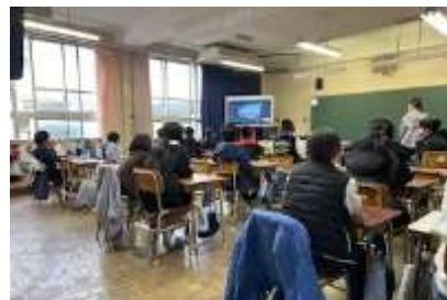
<高良内小の子どもたちの様子>