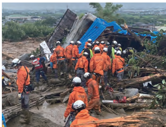
7月大雨災害救助の様子

火災の主な原因は、「たばこ」が12件、落ち葉たきなどのたき火が11件、コンセントなどの電気配線の異常によるものが8件です。1位のたばこは、灰皿以外の燃えやすい場所に捨てられて火災になったケースが多く見られました。吸い殻を水につけるなどして確実に火を消し、寝たばこはやめ