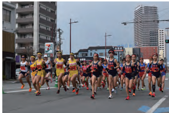
九州中から参加した選手らが、交通規制を行ったまちなかの車道を走りました

1月28日に「第43回久留米ロードレース」が行われました。昭和57（1982）年に始まった公認ロードレースで、ランナーは市内中心部を駆け抜けます。今年の参加は、高校生から社会人までの男女197人。男子は10kmで市陸上競技場から、女子は5kmで市役所前から久留米百年公園のゴールを目指しました。ベストタイムは男子が30分55秒、女子が16分17秒でした。