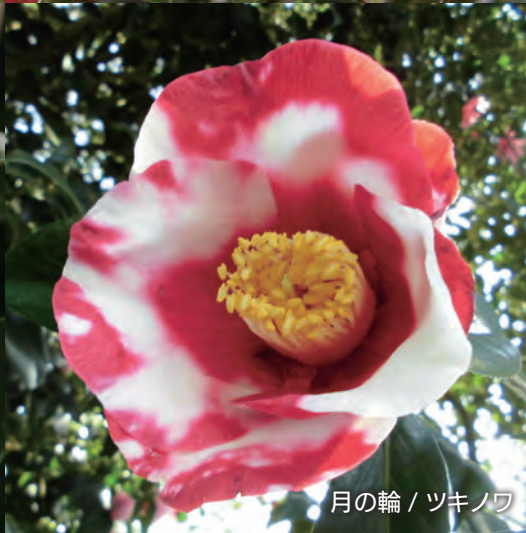
月の輪 / ツキノワ