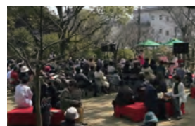
バイオリンやオーボエ奏者によるコンサート

3月17日(出)と23日(出)、ツバキに囲まれた広場でコンサートを開催。各日12時と14時30分から。