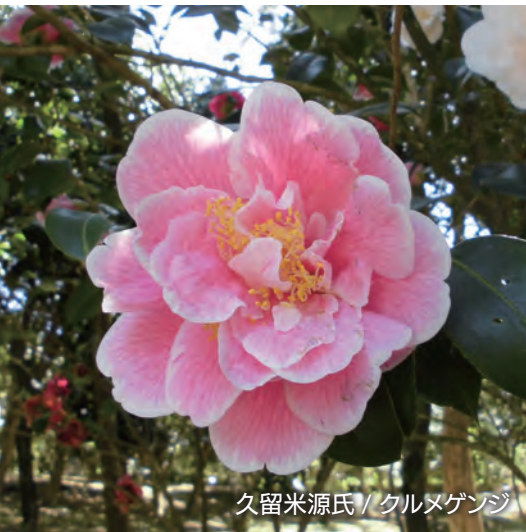
久留米源氏 / クルメゲンジ