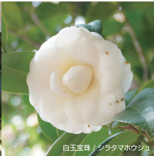
白玉宝珠 / シラタマホウシュ