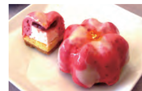
「正義」をイメージしたケーキ

石橋文化センター内にある喫茶店「楽水亭」でつばきメニューが販売されます。3月2日(出)から4月7日(出)まで。