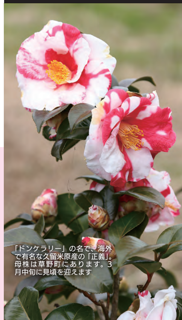
「ドンケラリー」の名で、海外で有名な久留米原産の「正義」。母株は草野町にあります。3月中旬に見頃を迎えます