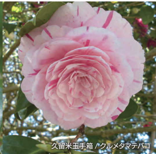
久留米玉手箱 / クルメタマテバコ