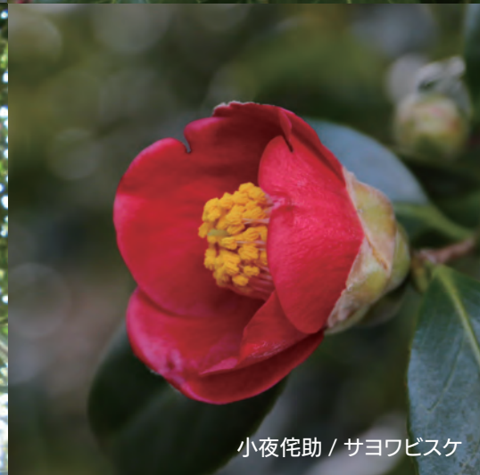
小夜侘助 / サヨワビスケ