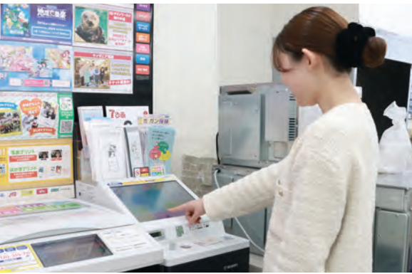
混雑した窓口には並びず証明書が取得できます

年度末は転勤や進学などで引っ越しをする人が多く、窓口が混雑します。時には3時間以上の待ち時間になることも。コンビニやオンラインでも手続きができます。