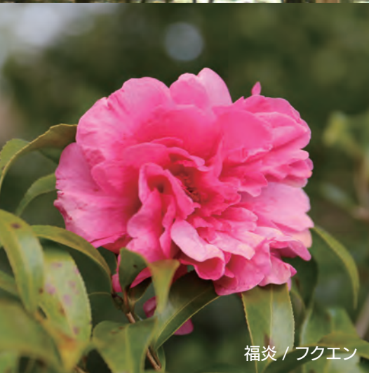
福炎 / フクエン