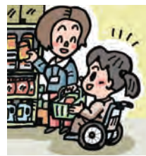
代わりに商品をとって手渡すことも