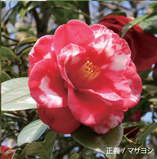
正義 / マサヨシ