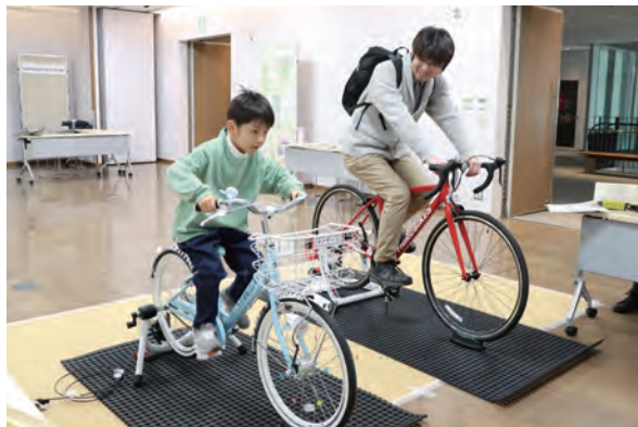
自転車をこぎ、モニター内で模擬レースをするタイムトライアルに挑戦

2月12日に久留米シティプラザで「チャリフェスPlus2024」が行われました。自転車の魅力を知って、たくさんの人に乗りてもらおうと初開催。自転車の乗り方教室や4月から市でも始まるシェアサイクル「チャリチャリ」の試乗、オリジナル反射材ステッカー作りなどが行われました。珍しい自転車やグッズの展示には大人も見入っていました。