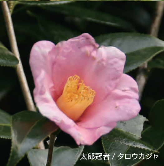
太郎冠者 / タロウカジャ