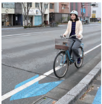
矢羽根型路面標示は自転車の通行位置と方向を示し、安全な通行を促します

間もなく新生活がスタートします。自転車は、通勤・通学しながら運動不足も解消でき、経済的でエコでもある便利な移動手段です。4月からは1分単位で利用できるシェアサイクル「チャリチャリ」が久留米市で始まります。ルールを守って、自転車生活を楽しく始めましょう。