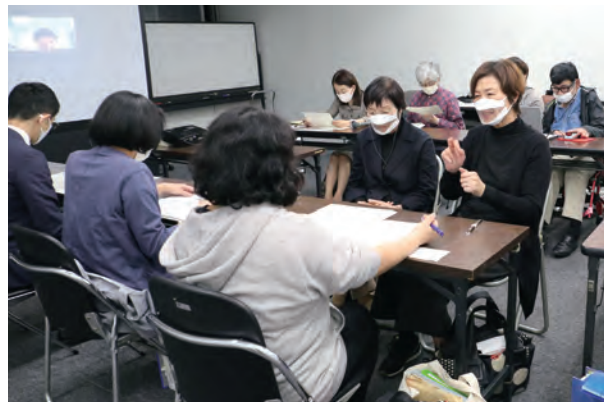
ワーキンググループを設置し、 制定に向けて話し合いました。 条例

誰もが普通に生活できる社会を つくるには、日常生活にあるさま ざまな障壁を取り除く「合理的配 慮」が必要です。障害のない人を 基準につくられた、施設の構造や サービスなどにある「当たり前」 が、障害のある人にとっては、大 きな妨げになることがあります。 さらに、事業者の合理的配慮の 提供も義務化しています。条例が 施行される4月1日には、改正障 害者差別解消法も同じように義 務になり、事業者の配慮を強く求 めています。誰もが共に生活でき