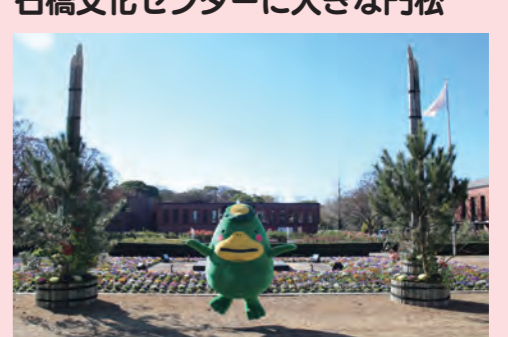
1月8日(木)まで石橋文化センター正門に高さ約5mの門松が飾られています。訪れた人は見上げながら写真を撮っていました。