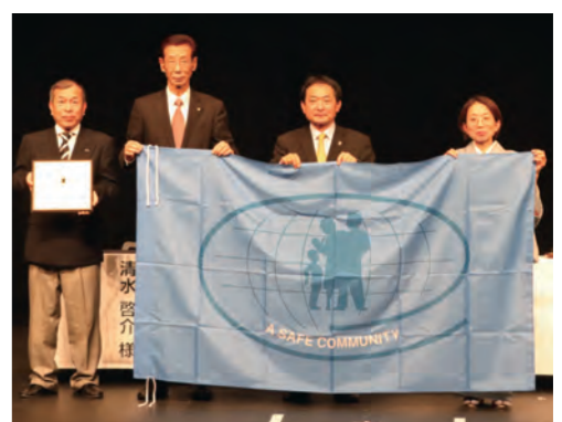
認証を記念して、国際セーフコミュニティ認証センターから盾と旗が贈られました

久留米市の「安全安心のまちづくり」の取り組みが評価され、3回目のセーフコミュニティ国際認証を取得しました。これまでの成果と取り組みのポイントを紹介します。 3回目の認証 「身の回りで起こるけがや事故は、予防で減らすことができる」というセーフコミュニティの基本的な考え方に基つき、市は、平成23年から市民の皆さんと協働して「安全安心のまちづくり」に取り組んでいます。 昨年8月に行われた国際認証審査