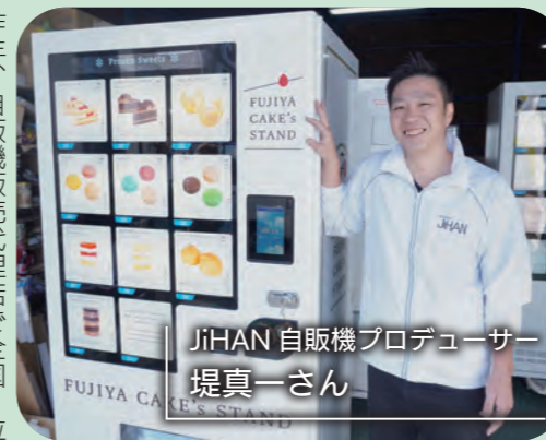
JiHAN 自販機プロデューサー 堤真一さん