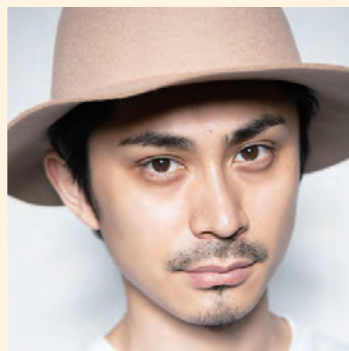
Pantovisco パントビスコ SNSの総フォロワー数が80万人を超えるクリエイター。久留米市出身