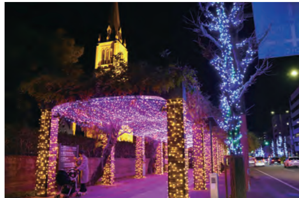
藤棚に設置された「光のトンネル」。ライトアップされたカトリック久留米教会もまちなかに彩りを添えます

12月8日に「第19回くるめ光の祭典」とめきファンタジー」が始まりました。久留米シティプラザの六角堂広場で点灯式を開催。来場者のカウントダウンで、明治通りや西鉄久留米駅東口広場などのイルミネーションが一斉に点灯しました。シティプラザ西側の六ツ門テラスや日吉町交差点近くには「光のトンネル」などのフォトスポットもあります。2月18日(日)まで。