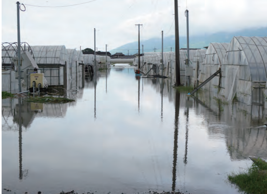
7月10日、北野町では農業用ビニールハウスが広範囲で、浸水しました