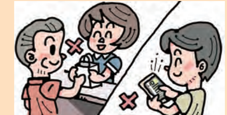
店舗に向いて購入した商品や通信販売にクーリング・オフ制度は適用されません

消費者側から一方的に契約を解除できるクーリング・オフ制度があります。ところが購入方法によって、適用されないこともあります。近年増えているインターネット通信販売も対象外です。よくある事例を紹介します。