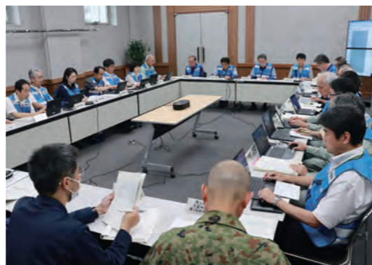
7月10日、災害対策本部を設置。国県と情報共有し、被害の把握を急ぎました

市全域に緊急安全確保が発令中の10日15時には、最大で382世帯、704人が避難しました。大橋小避難所周辺が冠水し一時孤立。消防署員や市職員が住民を耳納市民センターに移しました。保育園や学校は臨時休園・休校。大雨の影響が大きい大橋小や竹野小は、夏休みを前倒しました。