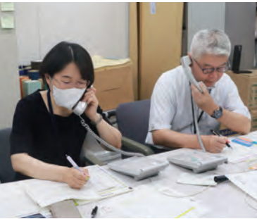
ごみ処分や証明書などの問い合わせに対応

「り災証明書」は、住宅の「全壊」から「準半壊に至らない（一部損壊）」まで6段階で被害の状況を証明するものです。支援金や制度の利用に必要な場合があります。申請により、市が被害状況を確認して、発行します。片付けや補修の後に申請する場合は、被害状況（浸水箇所や浸水の高さ）が分かる写真を撮っておいてください。撮り方は市ホームページに掲載しています。床下浸水の場合、写真だけで認定する「自己判定方式」での申請も可能。その場合は「準半壊に至らない（一部損壊）」となります。事業者の被害証明には「被災証明書」を発行します。 ◎生活支援第1・2課（☎0942・30・9023、FAX0942・30・9710）