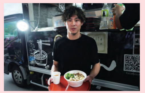
7月19日、田主丸総合支所で福岡ソフトバンクホークス所属の牧原大成選手が、大雨の被災者にうどんの炊き出しを行いました。