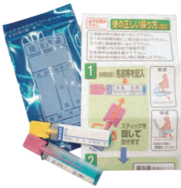
大腸がん検診のキット。便の採取だけで簡単です

大腸がん検診は便に血液が混じっていないかを調べる「便潜血検査」です。便を採取するだけなので、ほかのがん検診に比べてとても簡単。検診で異常が見つかったら、内視鏡検査を受け、がんかどうかをはっきりさせる必要があります。早期のがんなら内視鏡でがんを切り取るので、大きな手術は必要ありません。「大丈夫だろう」と自己判断して精密検査を受けないと、気付いた時にはかなり進行しているということにもなりかねません。大腸がんは早期発見できれば、5年生存率は90%を超えています。早期発見のために