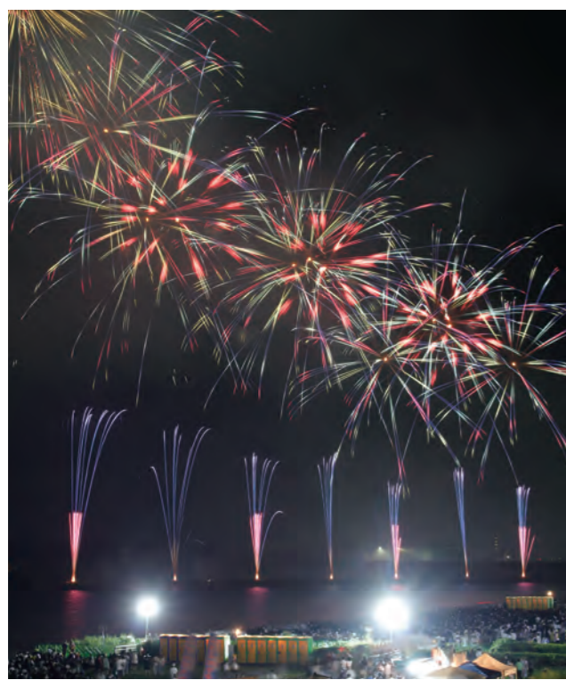
昨年の第363回筑後川花火大会の様子

※お願い 安全確保のため、交通規制を変更する場合があります。当日は現地の指示に従ってください