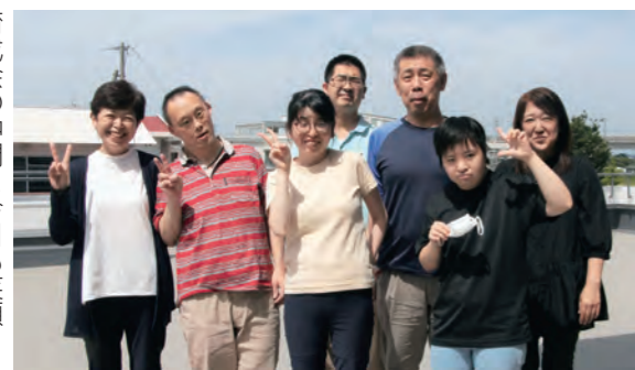
育成会の仲間と今日も笑顔

私には知的障害がある28歳の息子がいます。息子が小学生の頃、登下校で寄り道をしたり、病院の中を通り抜けたりして帰ることが度々ありました。探し回っていると警備の人や店の人が「あそこにいたよ」と顔と名前を覚えて教えてくれてとても助かりました。会員の中には、障害のあるなしに関係なく、放課後、小学校から