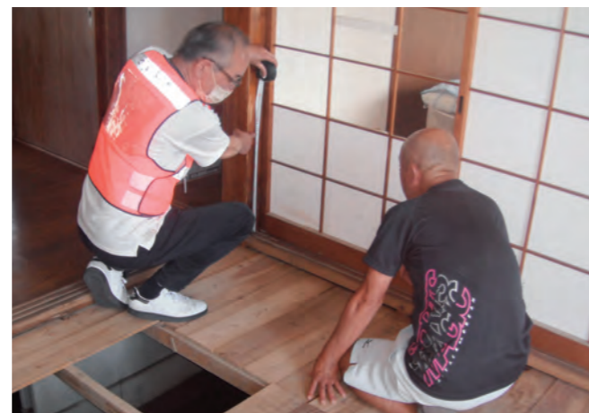
浸水した場所や高さ、外観を1件ずつ確認。被害の程度を判定します

◎消費生活センター （☎0942・30・7700、FAX0942・30・7715）