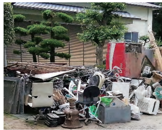
7月18日、大橋町石浦公園には、ぬれて使えなくなった家具が運び込まれました

かないといけないと思いました。日常を取り戻すため困っているときは、ボランティアを頼ってほしい」と話しました。 12日には、平成30年7月豪雨で被災した岡山県倉敷市から、土のう袋やブルーシートなどが到着。その後も国土交通省をはじめ、県や福岡市など他自治体から職員が派遣されました。須恵町から提供されたトイレトレーラーは現地の活動を支えました。復旧・復興に