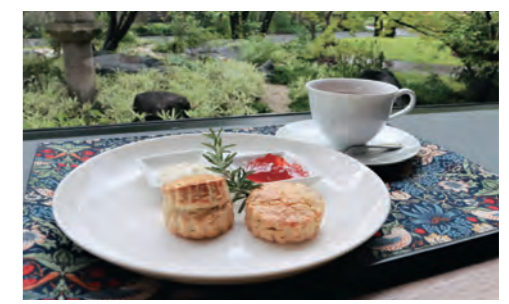
紅茶とブレインとローズマリー スコーンで優雅なティータイム

石橋文化センターのカフェ & ギャラリーショップ楽水亭では、市美術館で開催中のアーツ・アンド・クラフツとデザイン展にちなんで英国フェアを開催中です。本場のクリームティーセットなどを楽しめます。8月20日(日)まで。 ☎石橋文化センター (☎ 33-2271、FAX 39-7837)