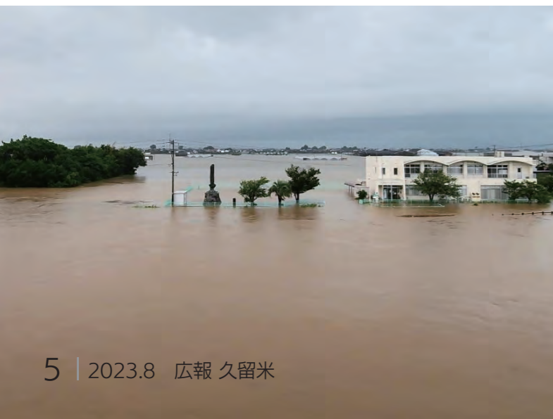
7月11日、写真手前の巨瀬川から越水。大橋コミュニティセンターが浸水しました