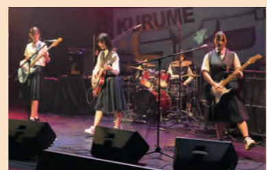
南筑高軽音楽部バンド Re.Limit(リミット)