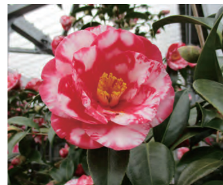
16ページに関連の記事があります