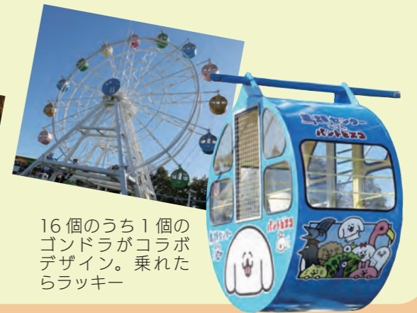
16個のうち1個のゴンドラがコラボデザイン。乗れたらラッキー

「道守」とは、道を舞台に清掃や花植えなどのボランティア活動をする人々のことです。九州7県で道守活動をしている団体が情報交換や交流を行う「道守九州会議」があり、行政と連携しながら活動しています。久留米市も、平成28年に「道守くるめネットワーク」を発足。現在、市内の21団体・企業など、約1100人の皆さんが活動しています。年に3回程度、明治通りやブリヂストン通りなどで除草や落ち葉の清掃活動をしています。4月1日(土)に、明治通りとJR久留米駅広場で清掃活動を実施します。申し込みなど詳しいことは問い合わせ先まで。 ◎公園緑化推進課 (0942・30・9087、FAX 0942・30・9707)