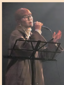
第4回ライブチャレンジで歌を披露したソラまめ

中高生をはじめとした出演者は、ポップスやロック、ジャズなどさまざまなジャンルの歌や演奏を披露しました。