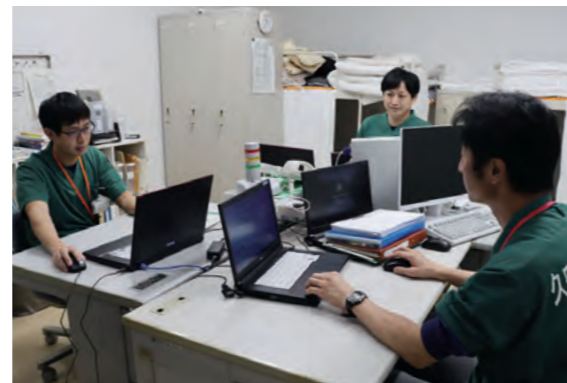
聖マリア病院内にある久留米広域消防本部救急ワークステーション

救急の現場は、言葉にできないようなプレッシャーを感じることもあります。日々の実践を重ね、より高度な技術を習得し続けなければいけません。病院内にある久留米広域消防本部救急ワークステーションに常駐し、救急搬送された傷病者が、病院でどのように