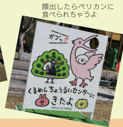
顔出したらペリカンに食べられちゃうよ