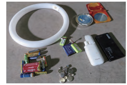
に蛍光管は購入したときのケースに入れても出せません