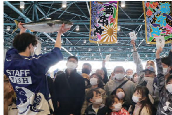
水産物の模倣せりでは、参加者が自分の番号札を上げて希望の値段で落札しました

2月11日に市中央卸売市場で、3年ぶりに「市場まつり」が開催されました。普段は入れない市場を、年1回、青果・水産共に開放。新鮮野菜の直売や海鮮丼など鮮魚を使ったグルメの販売があり、朝早くから売り場の前には行列ができました。模擬せりやバナナのたたき売りのイベントも行われ、模倣せりでは、品物を見定めて、参加者が真剣な表情で競り落としていました。