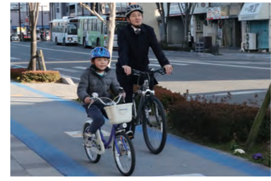
たヘルメットを選びましょう