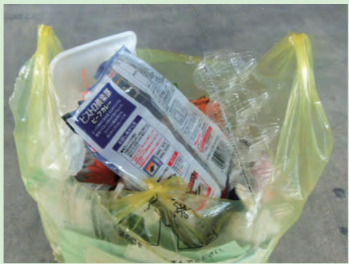
リサイクルできる卵のパック、食品トレイが燃やせるごみとして出されていることも

容器包装プラスチックとして出せるのは、プラマークがついている製品です。ペットボトルのキャップやラベル、菓子の包装などについています。食用油のボトルなど汚れが取れにくいものやプラスチック製のバケツなどマークがついていないものは、燃やせるごみとして出してください。