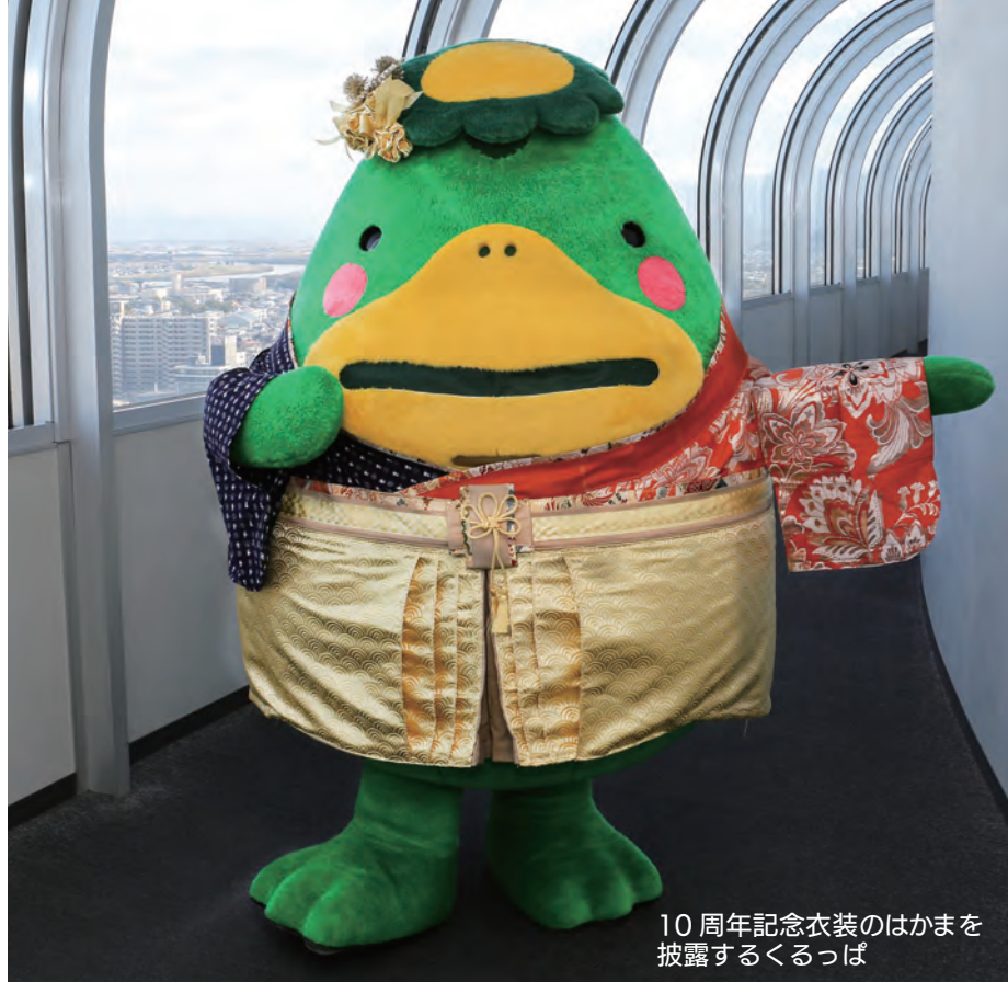
10周年記念衣装のはかまを披露するくるっば