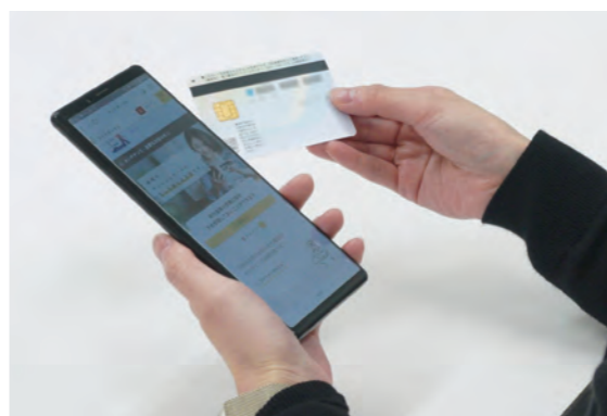
マイナンバーカードを使ったオンライン申請で、市役所に行く手間が省けます

久留米市は、窓口での手続きをオンライン化し、利便性の向上を図っています。 いつでもどこでも申請 3月1日から児童手当、児童扶養手当、妊娠届、保育、介護、被災者支援に関する手続きがオンラインで申請できます。市役所に行かなくても、自宅や職場でスマホやパソコンなどからいつでも申請可能です。 オンライン申請は、マイナンバーポータルサイトのぴったりサービスで利