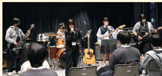
成果発表としてミニライブを開催しました

参加した高校生はプロのミュージシャンに積極的に質問。技術向上のために前向きに取り組みました。