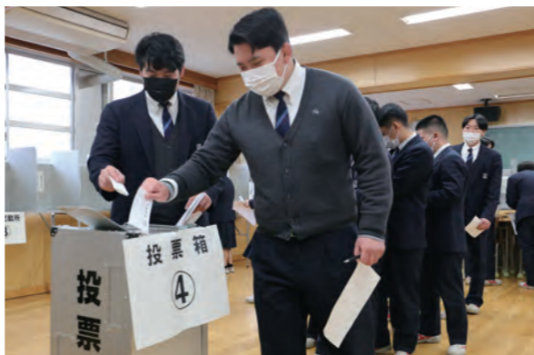
模擬選挙で投票箱に票を入れる南筑高の生徒たち

2月1日に南筑高で選挙啓発動画の発表会と模擬選挙が行われました。4月に実施予定の第20回統一地方選挙に向けた啓発の一環。動画は選挙に行くメリットや不在者投票の仕組み、選挙運動などについて解説しました。模擬選挙は、実際に使用される投票箱などをそそぐえて、投票や開票作業を実施。動画の制作や全体の運営は久留米大生と共同で生徒自身が行いました。