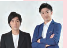
インクルージョン (福岡よしもと)