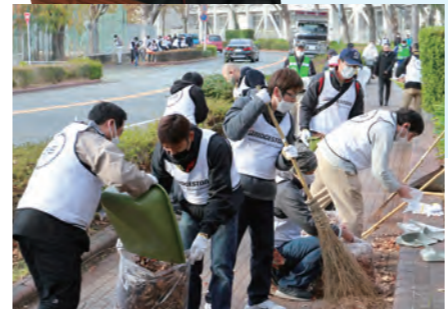
昨年12月に開催した「道守くるめネットワーク」の清掃活動には、社員約130人が参加しました