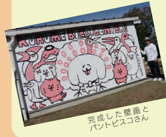
完成した壁画とパントビスコさん