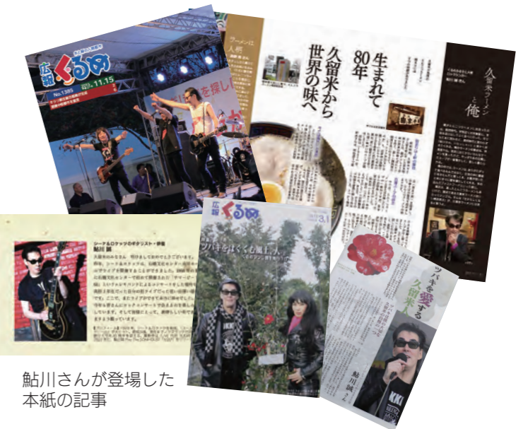
鮎川さんが登場した本紙の記事