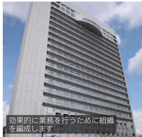
効果的に業務を行うために組織を編成します

市は組織を一部改正します。実施日は4月1日(土)です。 【総務部】■複雑・多様化する行政課題への法的対応強化のため、総務課に「法制室」を新設 ■職員採用から育成まで一貫した人材育成のため、人事厚生課に「人材育成室」を新設 【都市建設部】■広域事業調整課を「国県事業調整課」へ改称 ■建築指導課の都市計画法に基づく開発行為の許可などに関する業務を都市計画課へ移管。老朽化した危険な空き家などに関する業務を住宅政策課へ移管 ■市営住宅に関する業務を担う「市営住宅課」を新設 【教育部】■全国的に急増している不登校児童生徒への対応のため、不登校対策に関する業務を学校教育課へ集約し、「校外適応指導教室