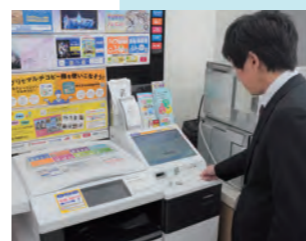
市役所に来る手間が省け、休日も利用できます

各種証明書は、コンビニエンスストアのマルチコピー機でマイナンバーカードを使って取得できます。取れるのは住民票の写し、印鑑登録証明書、所得証明書、戸籍全部(個人)事項証明書。休日も可能です。