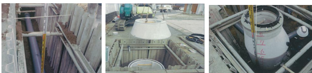
(管路の布設、マンホールの設置状況)

財政状況としては大変厳しいものとなっておりますが、有効な財源計画を図りながら、早期に未普及地域への整備を行ってまいります。