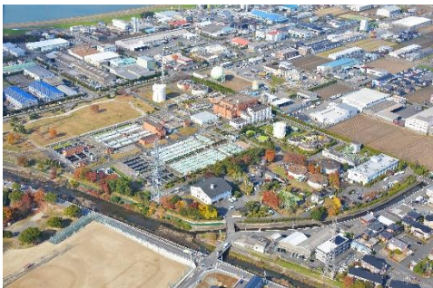
(中央浄化センター)