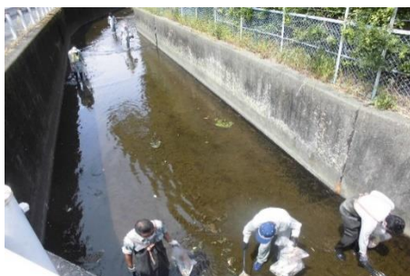
(筒川を清掃する様子)