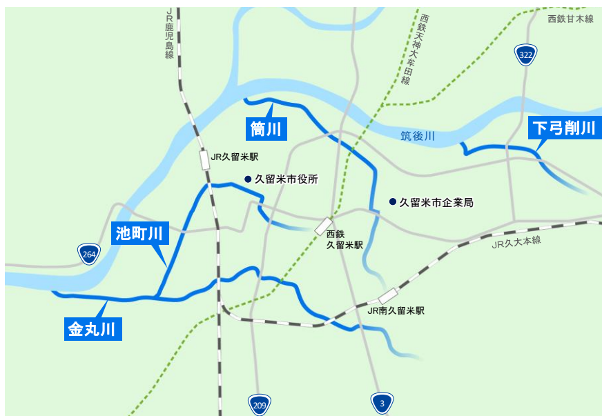
図 3-4-1 河川位置図