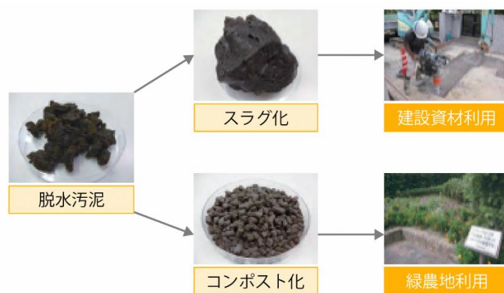
図 3-4-2 脱水汚泥の有効利用