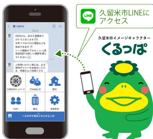
図 3-4-6 SNSによる広報のイメージ