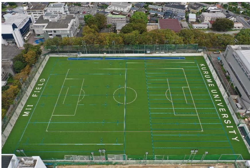
図 3-4-2 久留米大学雨水貯留施設