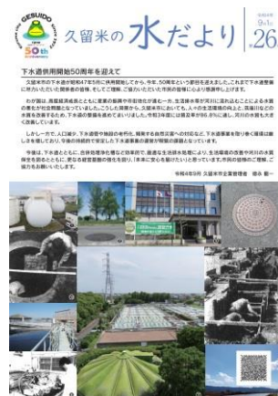
図 3-4-7 広報紙「久留米の水だより」