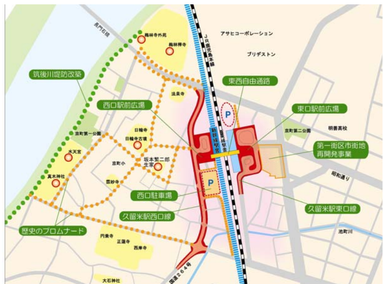
JR久留米駅周辺整備計画図

リー工事、自由通路や駅前広場機能の整備を実施しており、一定の市街地整備事業が完了している。