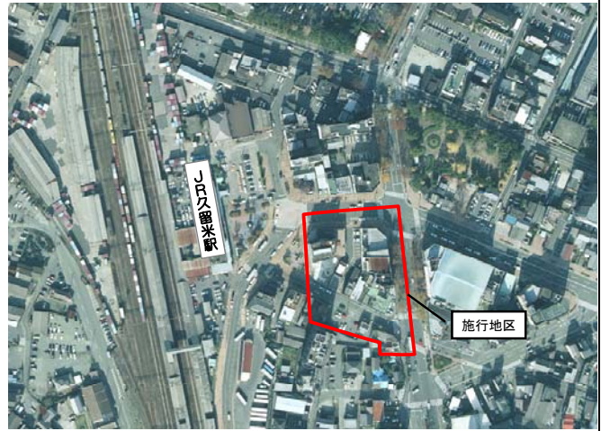
JR久留米駅前第一街区市街地再開発事業施行区域

現在、在来線を中心として広域交通の拠点となっているJR久留米駅周辺では、平成 23 年春の九州新幹線駅の開業を控え、駅前広場や自由通路、周辺の街路整備など、JR久留米駅周辺地区の整備を緊急の課題として位置付け、継続して取り組んでいる。また、JR久留米駅前では、平成 18 年 12 月に福岡県から認可された再開発組合による市街地再開発事業が進められている。