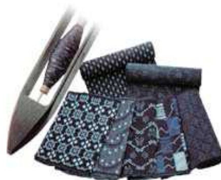
久留米絣(くるめがすり)

江戸時代後期、少女が考案した図柄を取れ入れて爆発的に普及した久留米絣は、久留米市の繊維産業発展の礎を築いていった。産業と交通が発達してくると紡績や足袋会社が設立されたが、日露戦争後、第 18 師団や歩兵第 56 連隊などの諸部隊が設置され、軍都としての性格が濃厚になった。