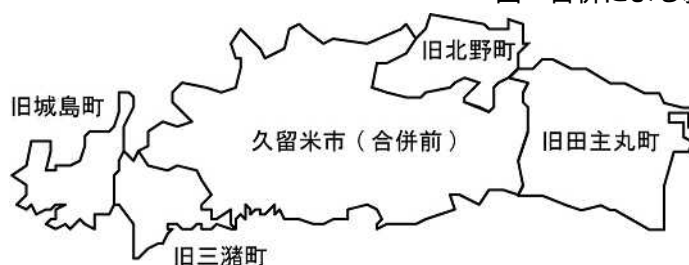
図 合併による新久留米市の市域

平成 13 年から既に特例市に移行している久留米市は、平成 17 年の合併で人口 30 万人以上の要件を満たしたため、平成 20 年 4 月 1 日に民生行政や保健衛生行政、環境行政、都市計画行政などの事務が県から移譲され、市民サービスが向上する中核市移行を目指している。