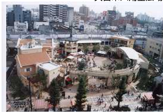
久留米六角堂広場

しかし、福岡市天神地区や周辺市町に立地する大型商業集積への消費者流出、IT時代におけるインターネットを活用した無店舗販売の拡がりなどで、大型店や商店街で構成する中心商業の年間販売額は低下し、とりわけ旧態依然の商店街に対する消費者の支持は薄らいでいった。