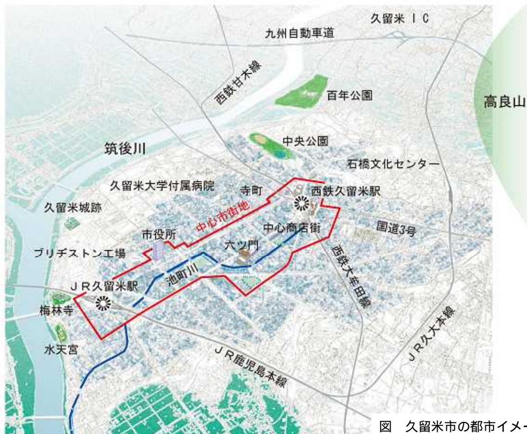
図 久留米市の都市イメージ

久留米大学付属病院や聖マリア病院など高度医療を提供する病院があることも都市機能の特徴の一つであり、市民1人当たりベッド数も全国有数となっている。また、市内には大学、短大、専門学校が集積し、学生の多い街でもある。平成16年には久留米市内の5つの大学等が「単位互換」協定を締結している。