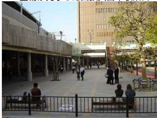
整備が完了した西鉄久留米駅東口

都市景観形成事業については、平成 20 年 4 月の中核市移行により景観行政団体になることを受け、景観法に基づく景観計画の策定準備を進めている。平成 22 年度には、景観計画の実効性を確保するため、景観条例を定め、県南の中核都市久留米にふさわしい美しく魅力ある都市づくりに取り組んでいく。