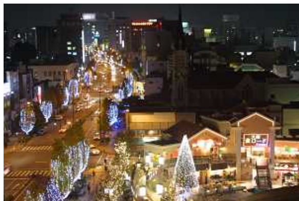
国道や公共広場を活用したイルミネーション

商店街の「土曜夜市」や「市民とつくる花と緑のまちづくり」など既存事業の充実を図るとともに、清掃・案内などを行う学生ボランティア「ほとめき隊」、地産地消「六角堂昼市」、国道の樹木へのイルミネーション「光の祭典」、「キャンドルナイト」などの新規事業を展開してきた。