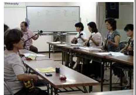
六ツ門大学（三線講義）の風景

TMO や商店街、大型店、商工団体、市民などが結集し、冬季の賑わいづくりとして平成 17 年から通りや広場を光で彩るイルミネーション事業「光の祭典」を行っている。