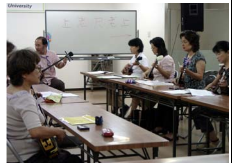
六ツ門大学（三線講義）の風景

TMO や商店街、大型店、商工団体、市民などが結集し、冬季の賑わいづくりとして平成 17 年から通りや広場を光で彩るイルミネーション事業「光の祭典」を行っている。