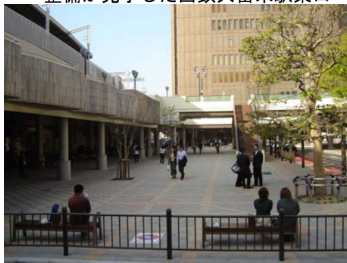
整備が完了した西鉄久留米駅東口

都市景観形成事業については、平成 20 年 4 月の中核市移行により景観行政団体になることを受け、景観法に基づく景観計画の策定準備を進めている。平成 22 年度には、景観計画の実効性を確保するため、景観条例を定め、県南の中核都市久留米にふさわしい美しく魅力ある都市づくりに取り組んでいく。