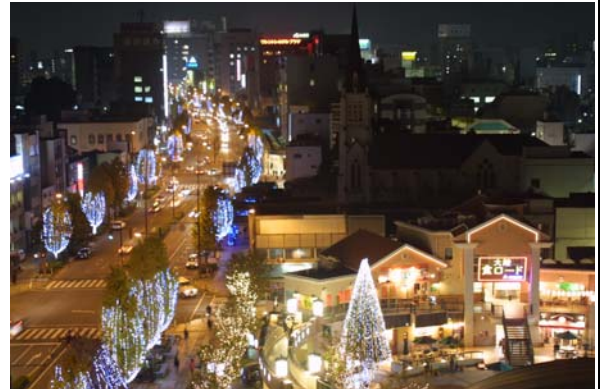
国道や公共広場を活用したイルミネーション

商店街の「土曜夜市」や「市民とつくる花と緑のまちづくり」など既存事業の充実を図るとともに、清掃・案内などを行う学生ボランティア「ほとめき隊」、地産地消「六角堂昼市」、国道の樹木へのイルミネーション「光の祭典」、「キャンドルナイト」などの新規事業を展開してきた。