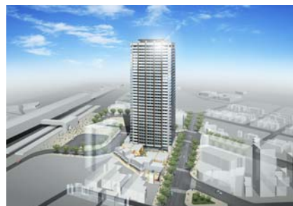
JR久留米駅周辺整備イメージ

新世界地区再開発事業は、計画予定地区のうち地権者の同意が整った第一工区において、21 年着工、22 年竣工を目指し、共同住宅を基本とした優良建築物等整備事業を推進している。