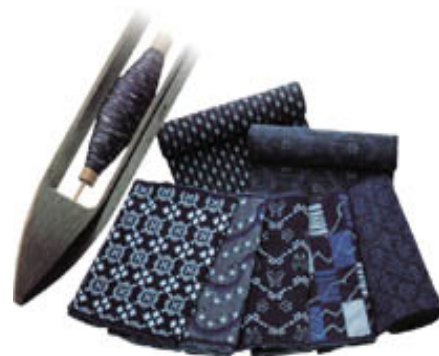
久留米緋(くるめがすり)

江戸時代後期、少女が考案した図柄を取れ入れて爆発的に普及した久留米緋は、久留米市の繊維産業発展の礎を築いていった。産業と交通が発達してくると紡績や足袋会社が設立されたが、日露戦争後、第 18 師団や歩兵第 56 連隊などの諸部隊が設置され、軍都としての性格が濃厚になった。