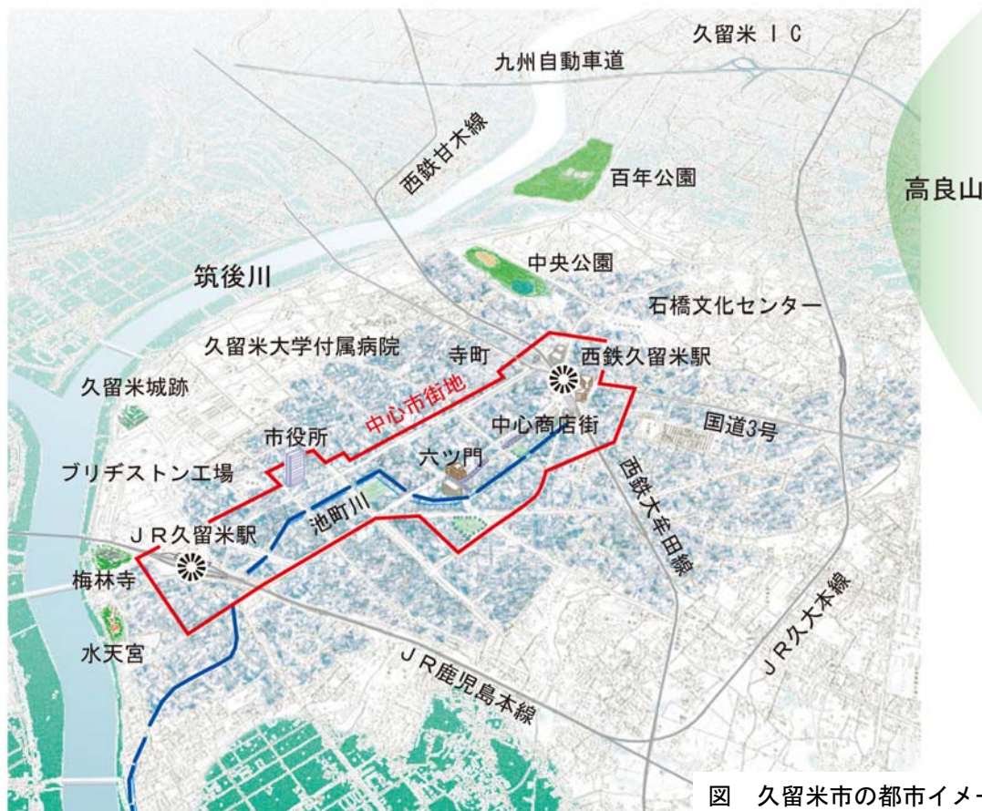
図 久留米市の都市イメージ

久留米大学付属病院や聖マリア病院など高度医療を提供する病院があることも都市機能の特徴の一つであり、市民1人当たりベッド数も全国有数となっている。また、市内には大学、短大、専門学校が集積し、学生の多い街でもある。平成16年には久留米市内の5つの大学等が「単位互換」協定を締結している。