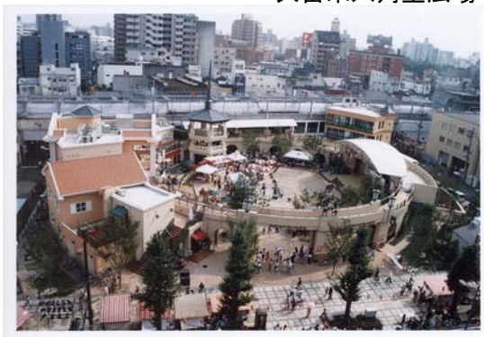
久留米六角堂広場

しかし、福岡市天神地区や周辺市町に立地する大型商業集積への消費者流出、IT時代におけるインターネットを活用した無店舗販売の拡がりなどで、大型店や商店街で構成する中心商業の年間販売額は低下し、とりわけ旧態依然の商店街に対する消費者の支持は薄らいでいった。