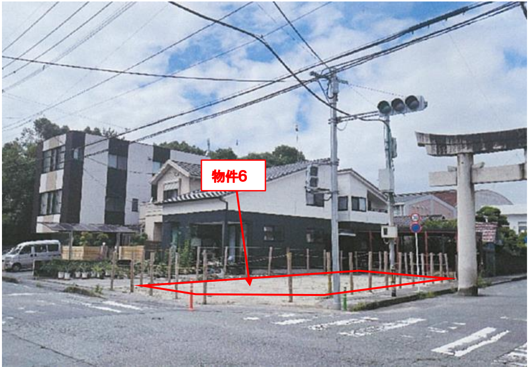
物件の南東側より撮影