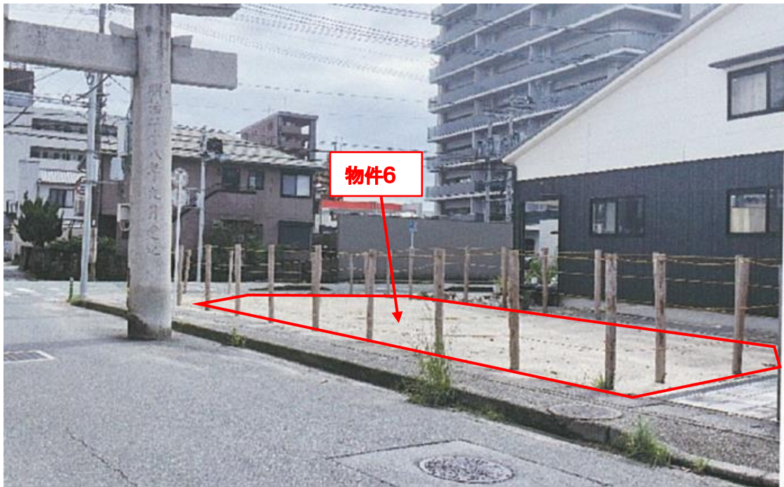
物件の北東側より撮影