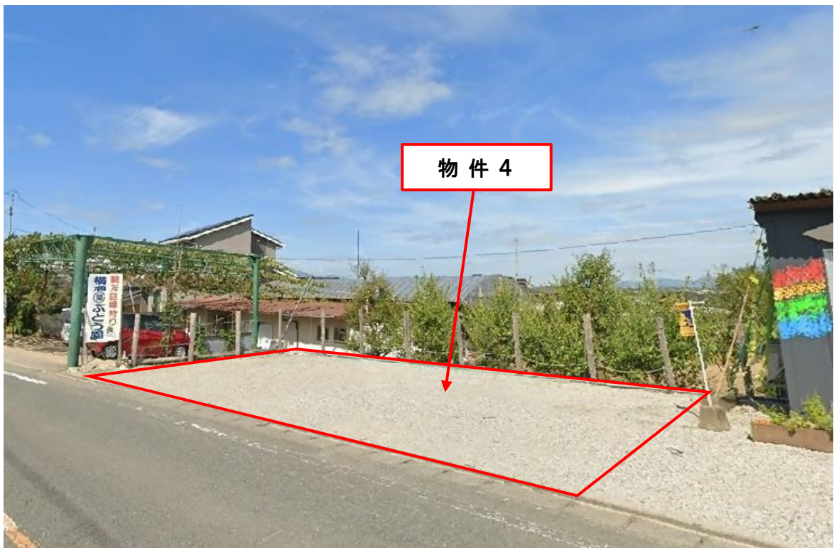
物件の東南側より撮影