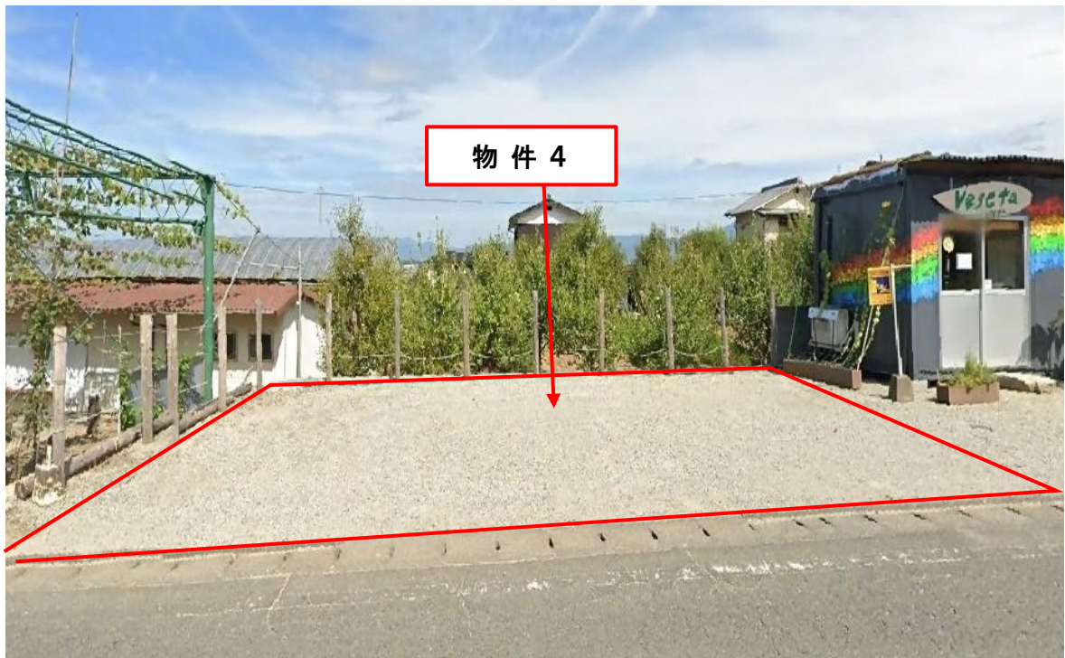
物件の南側より撮影