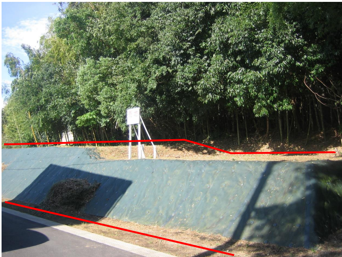
物件南側から北向きに撮影