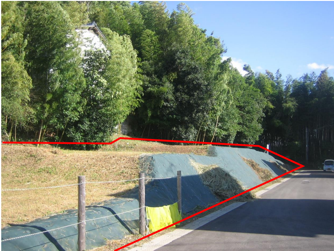
物件北側から南向きに撮影