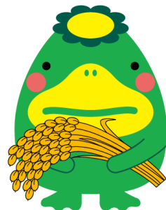
久留米市イメージキャラクター